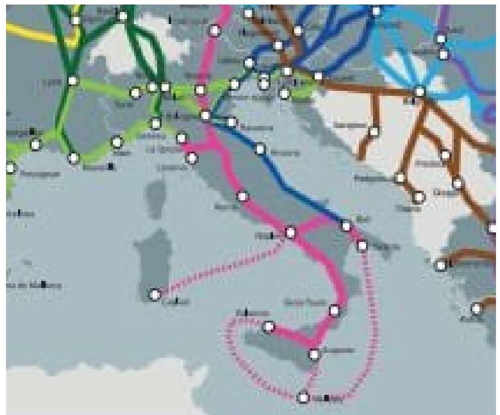
PROPOSTA DI MODIFICA