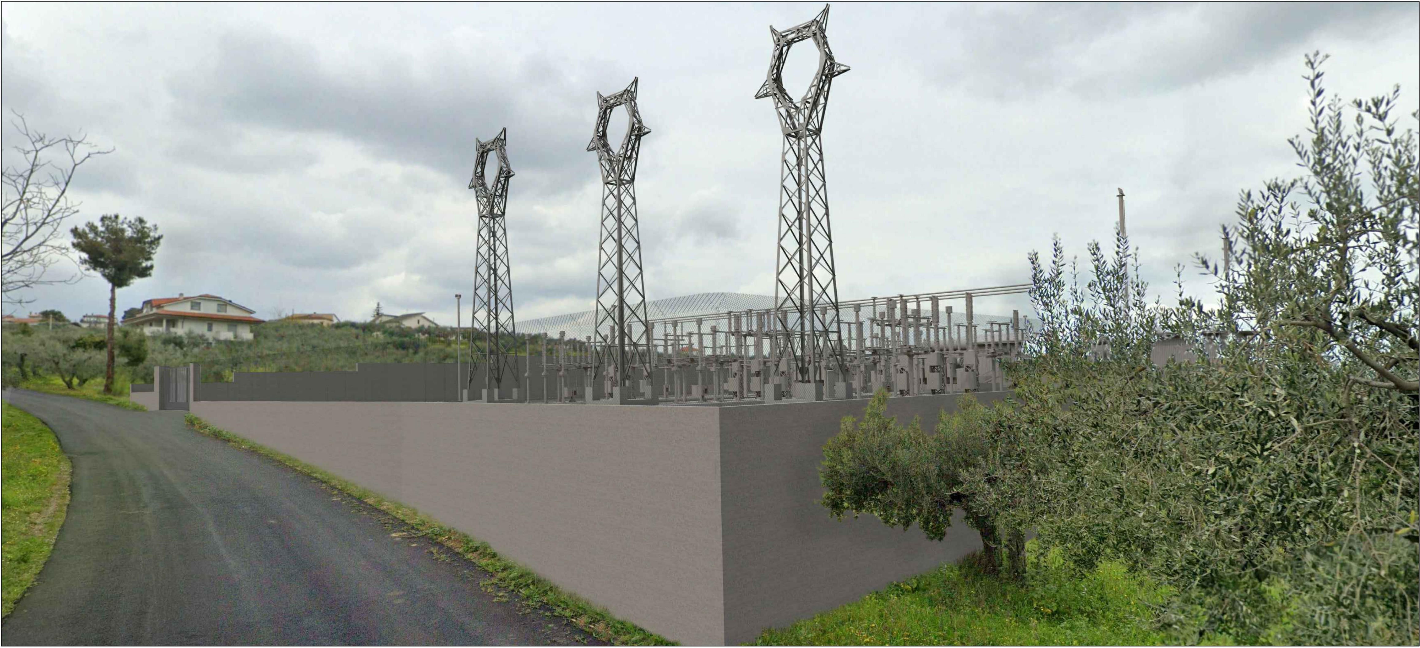
Fotoinserimento vista frontale