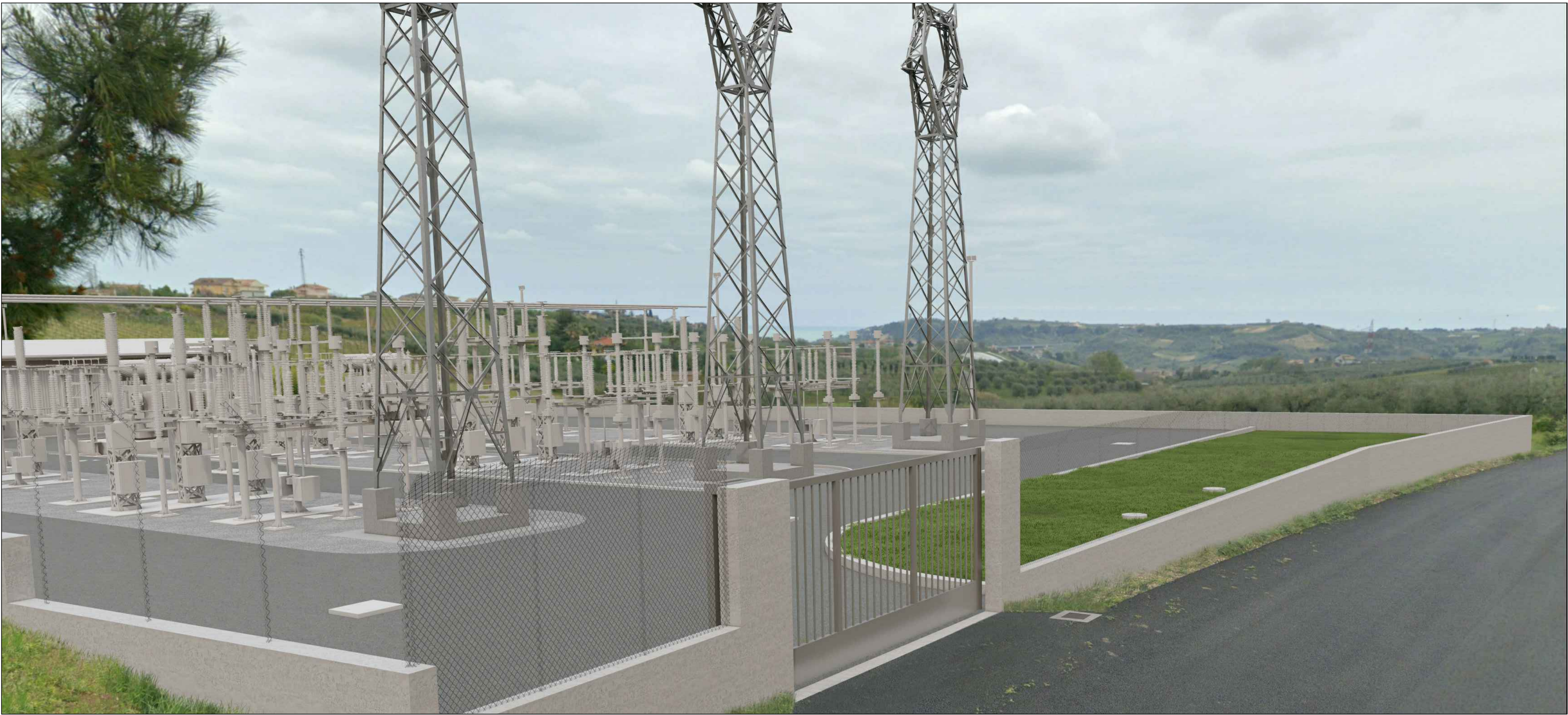
Fotoinserimento vista ingresso