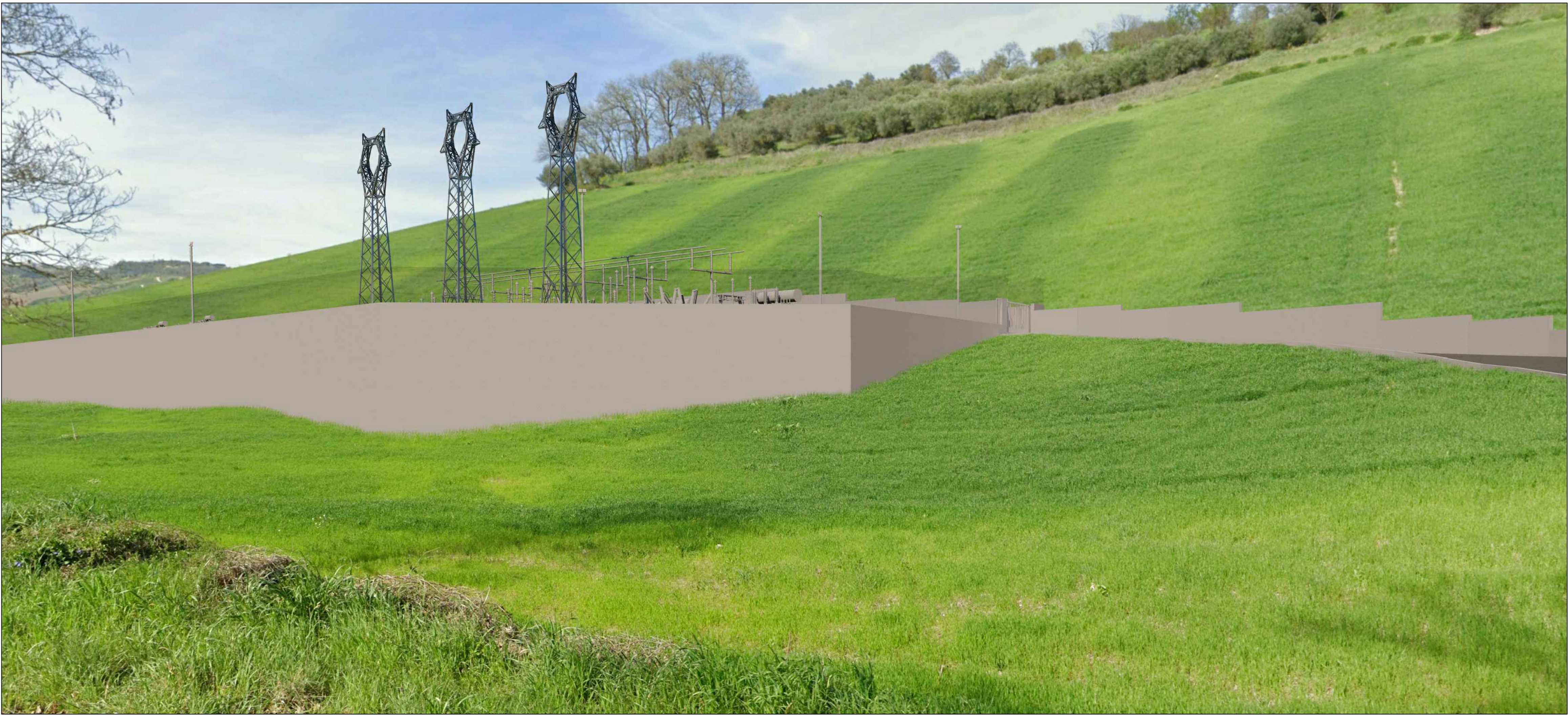
Fotoinserimento vista ingresso