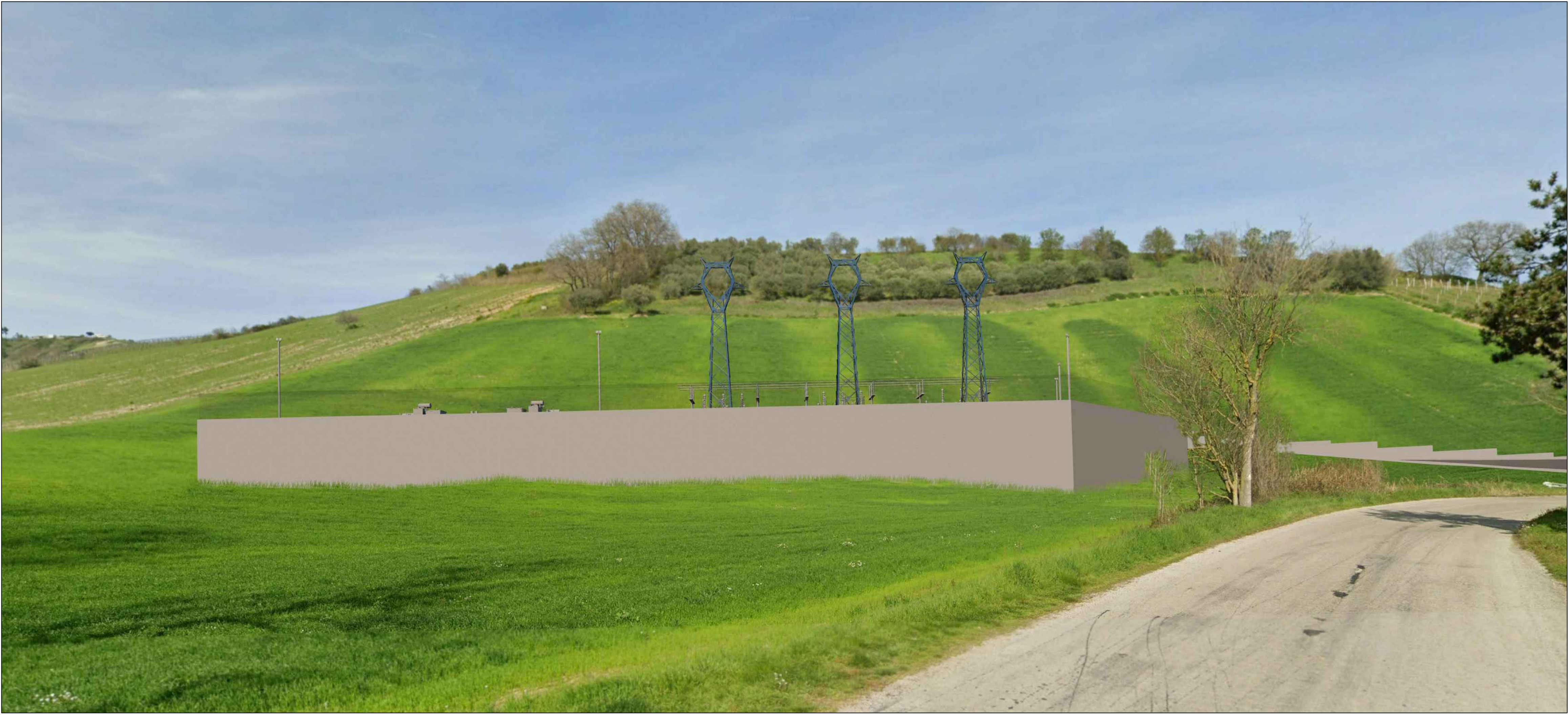
Fotoinserimento vista frontale