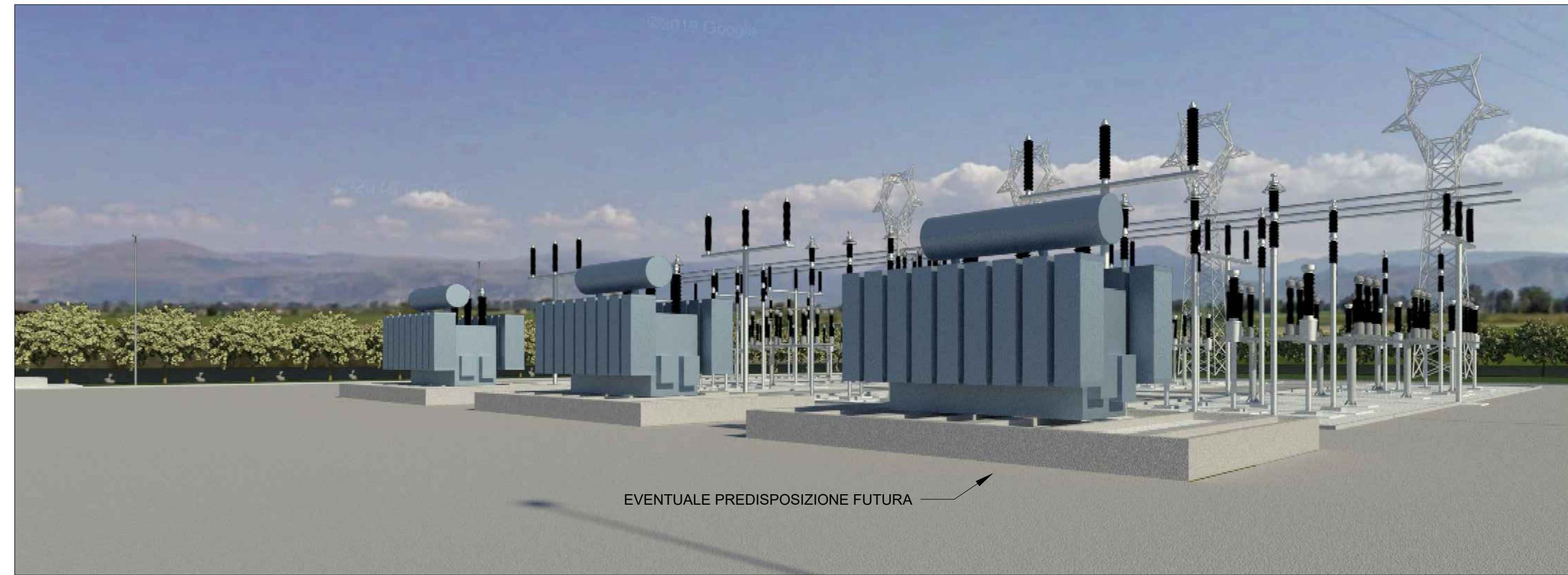
FOTO 02 - STATO DI PROGETTO