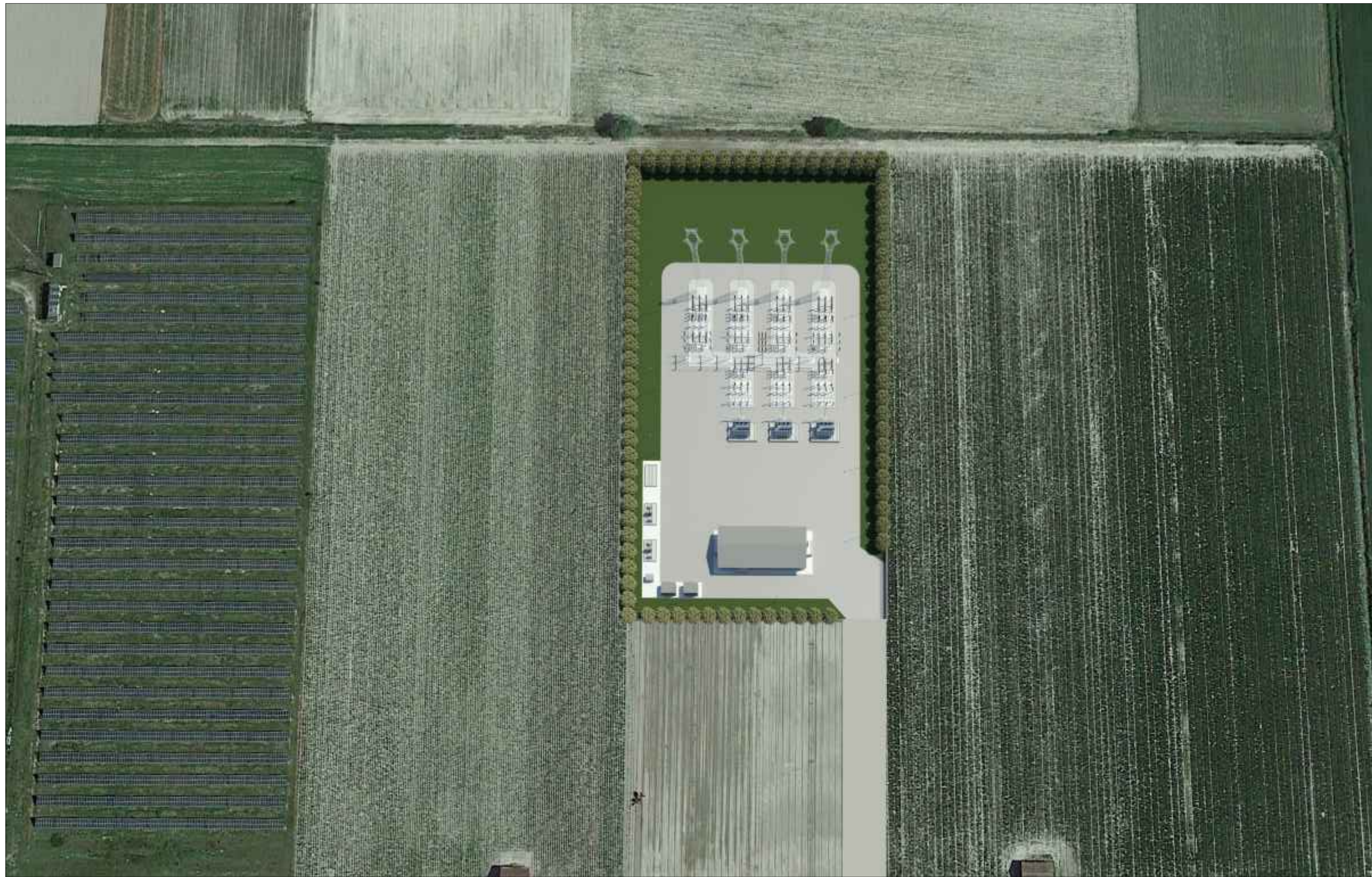
INQUADRAMENTO GENERALE VISTA 3D