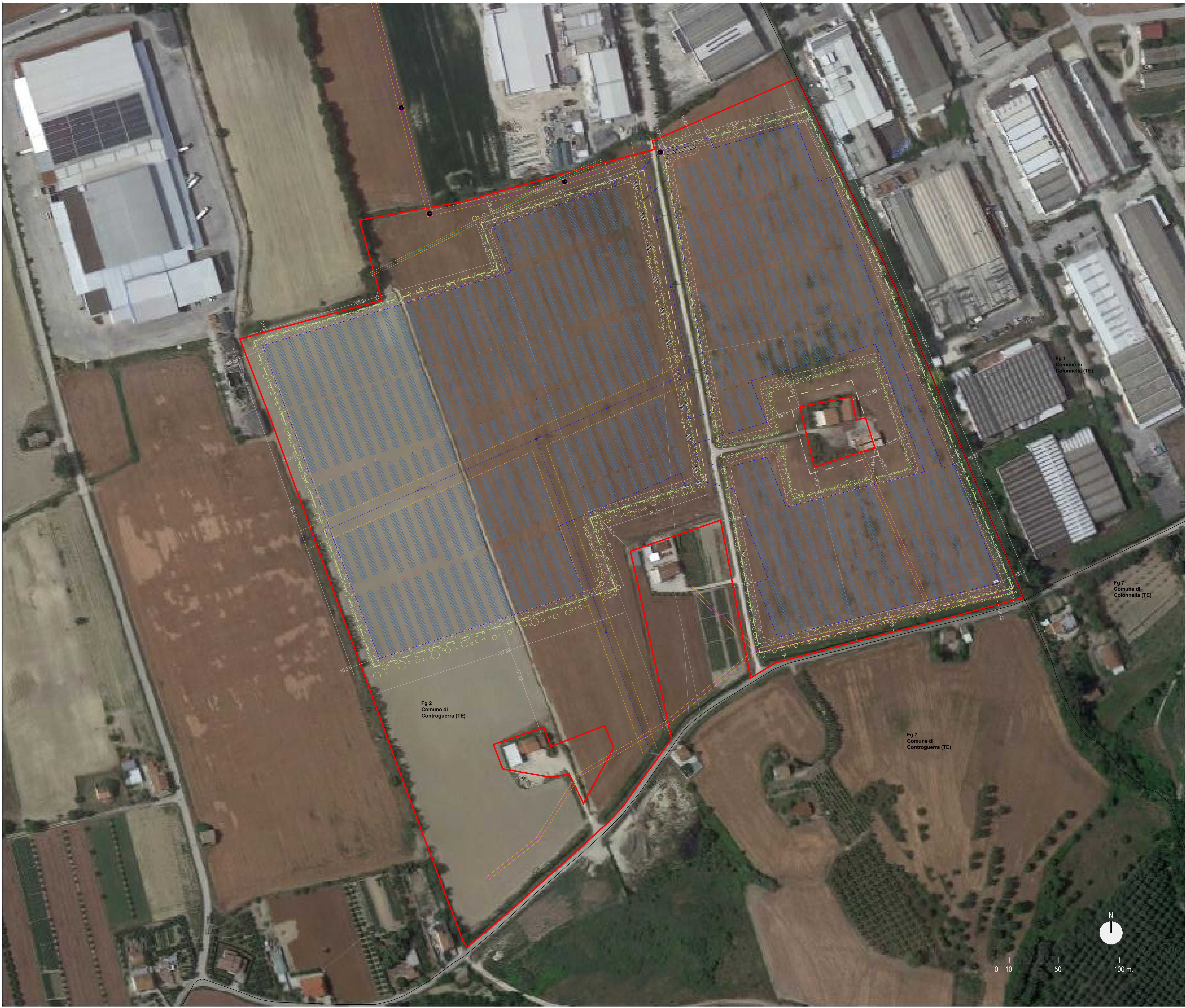
Fig 1 Comune di Controguerra (TE)