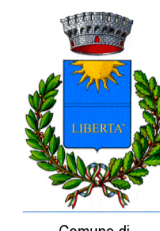
Comune di CASTELVECCHIO CALVISIO