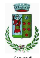
Comune di SANTO STEFANO DI SESSANO