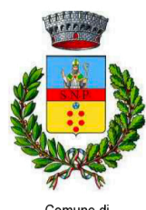
Comune di CALASCIO