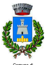
Comune di CASTEL DEL MONTE