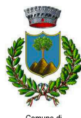
Comune di BARISCIANO