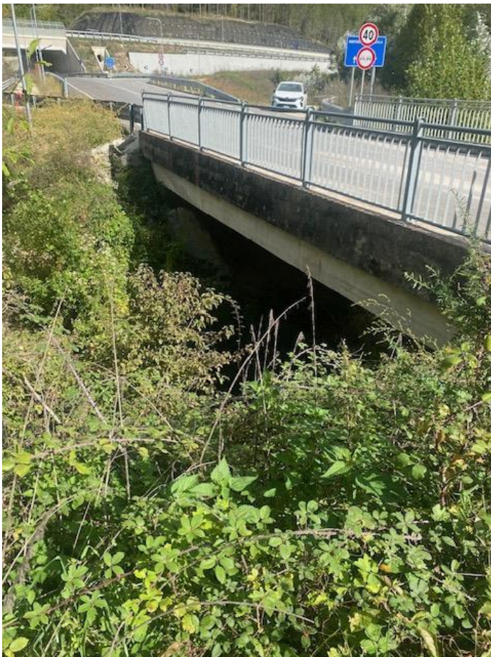
Figura 24 Scavo a sezione obbligata sotto attraversamento 25 mc