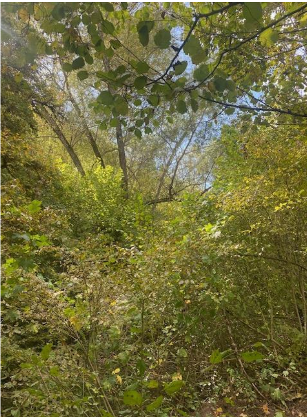
Figura 21 a 1 - 6 mc