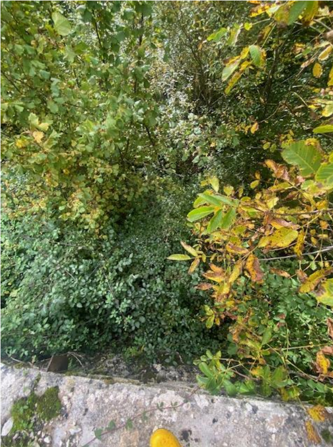
Figura 22 Scavo a sezione obbligata sotto il ponte 15 mc