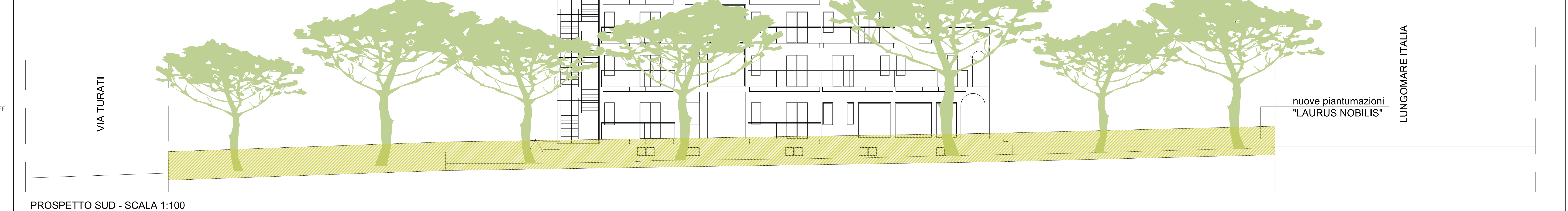
PROSPETTO SUD - SCALA 1:100