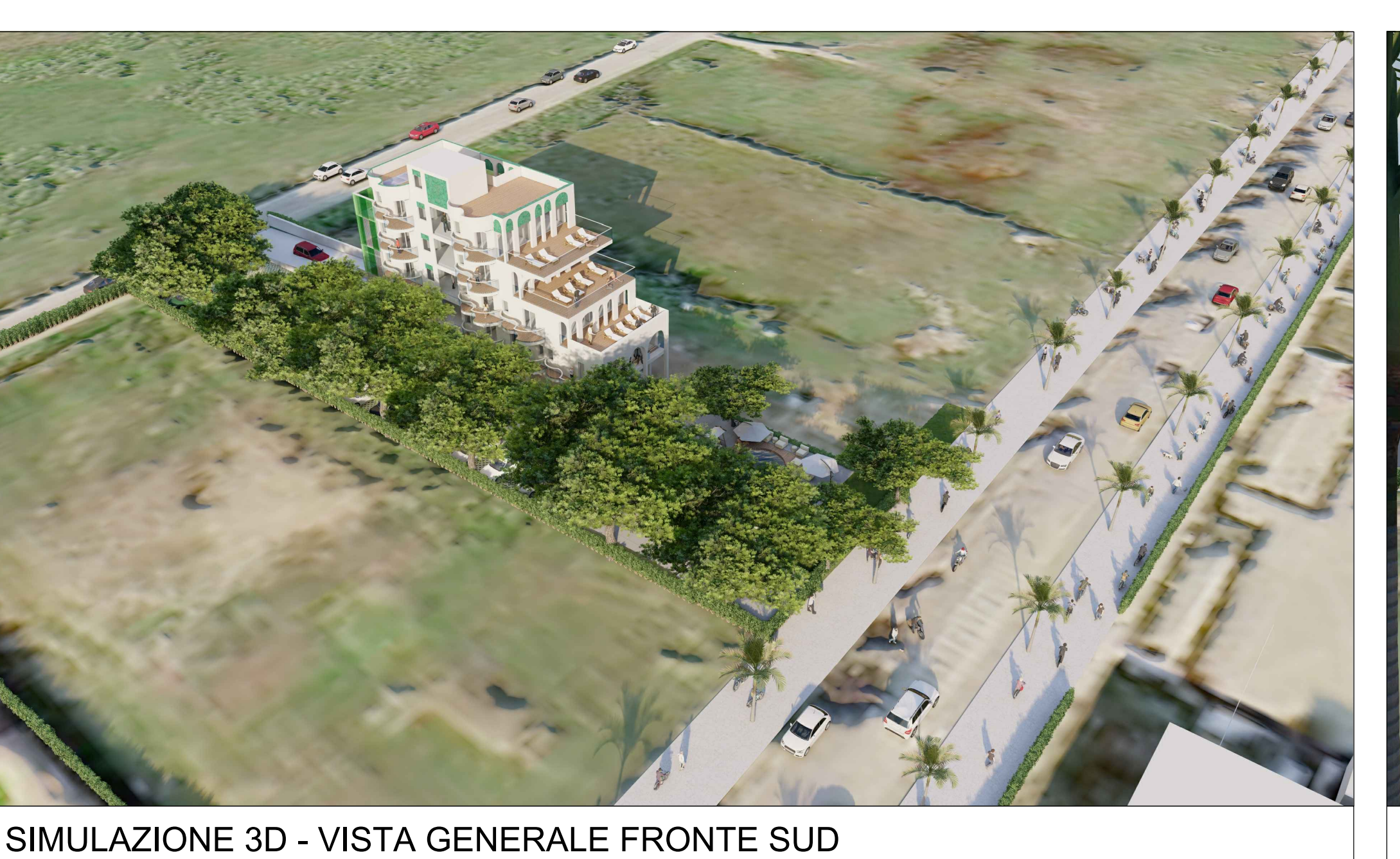
SIMULAZIONE 3D - VISTA GENERALE FRONTE SUD