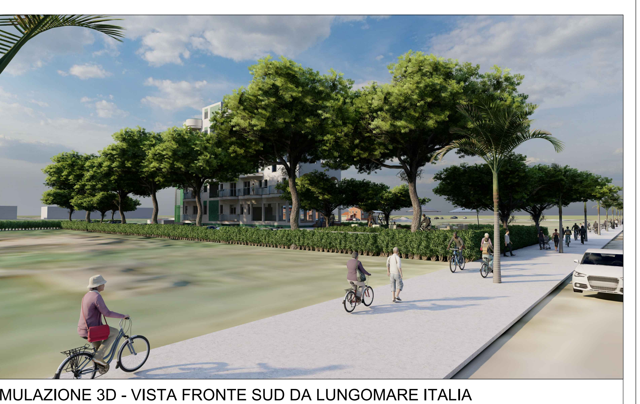
SIMULAZIONE 3D - VISTA FRONTE SUD DA LUNGOMARE ITALIA