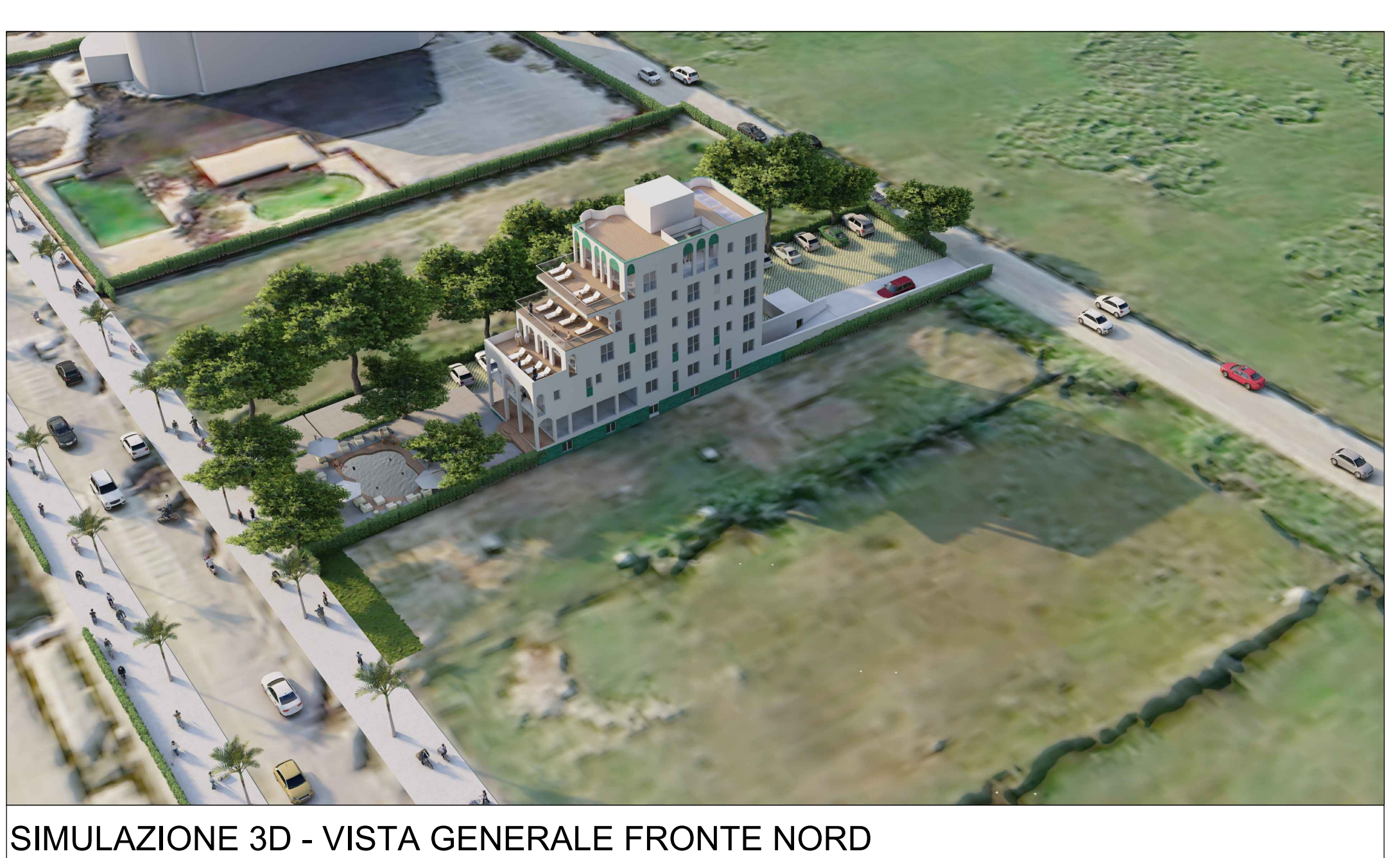
SIMULAZIONE 3D - VISTA GENERALE FRONTE NORD