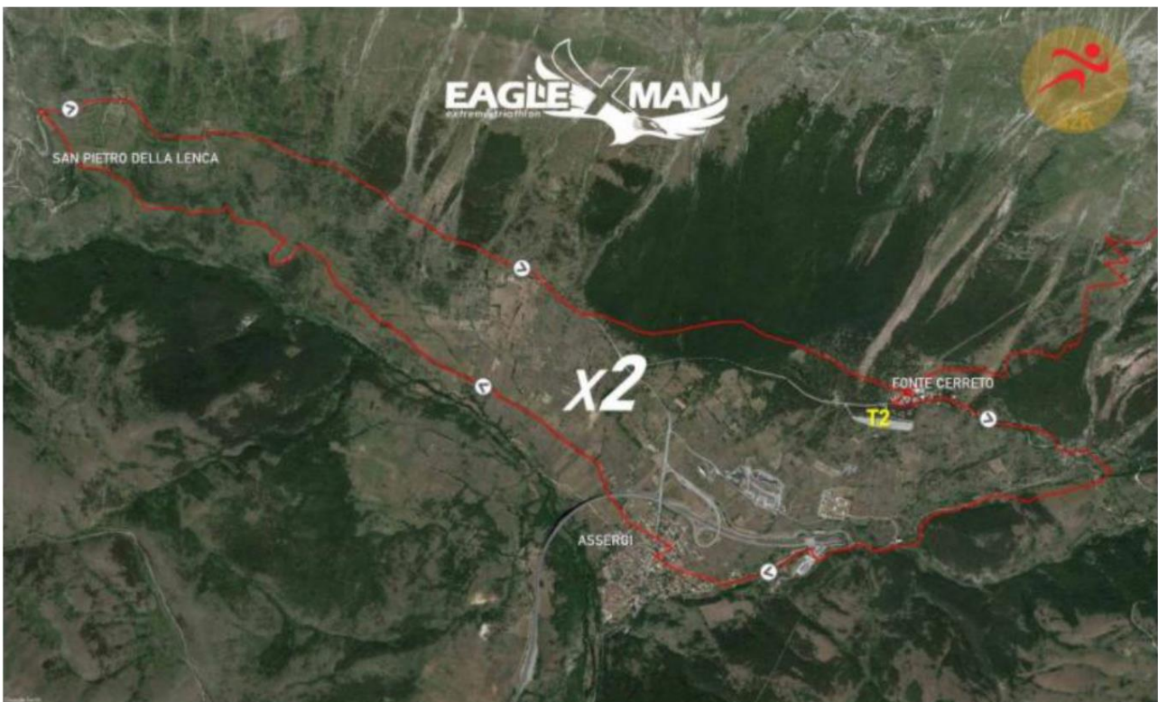
Figura 3 - Run Course