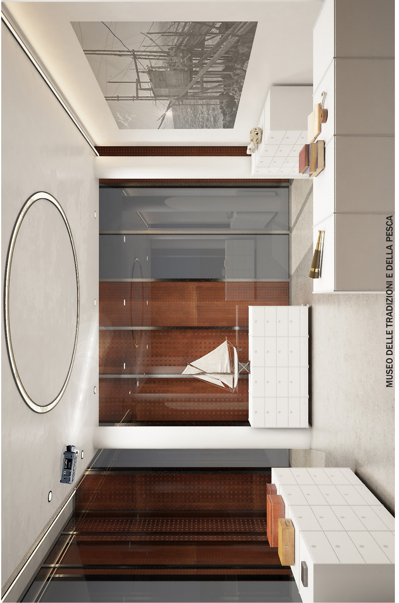
MUSEO DELLE TRADIZIONI E DELLA PESCA