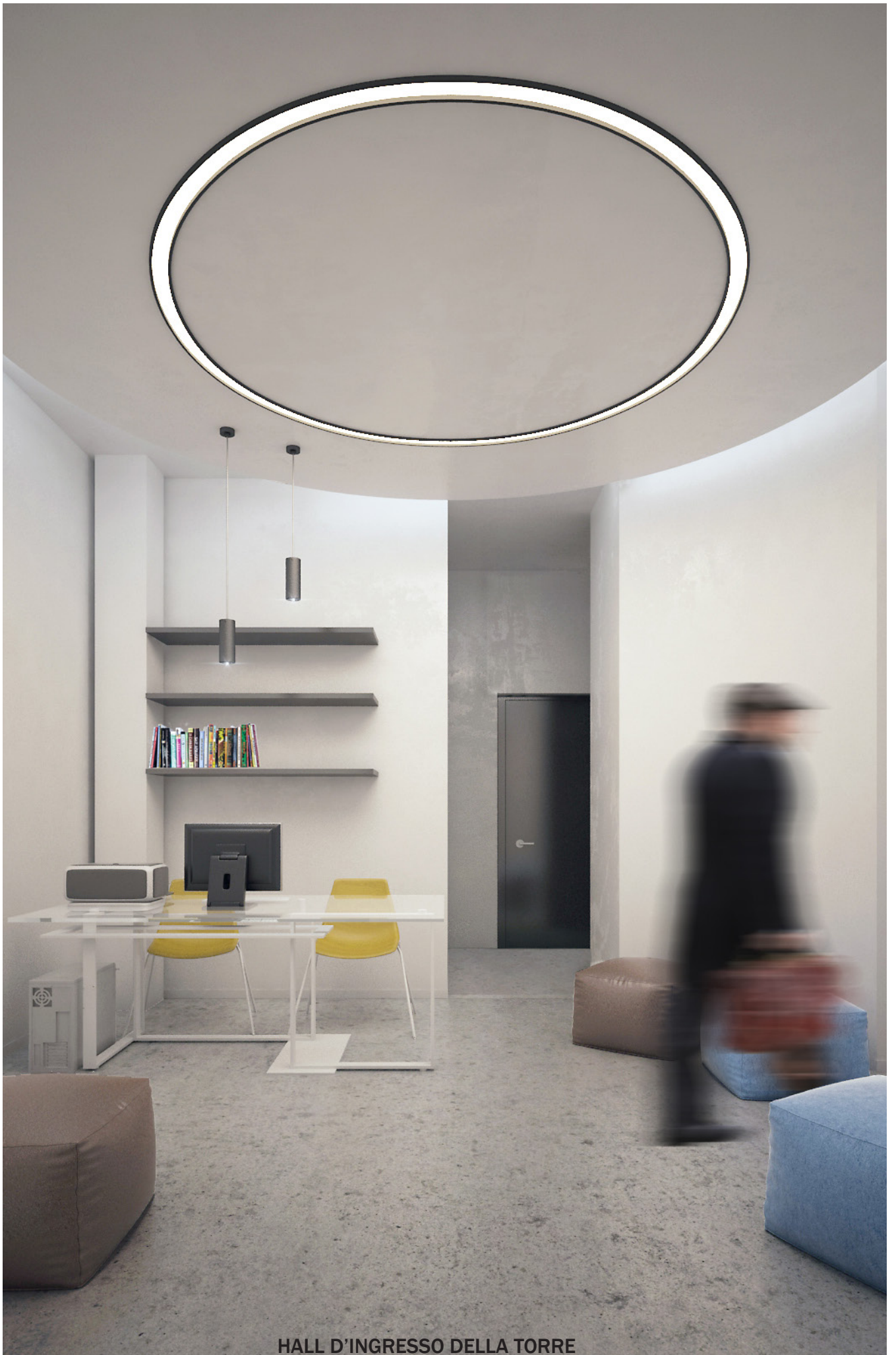
HALL D'INGRESSO DELLA TORRE