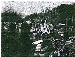
I finanzieri all'interno della discarica. In alto: il terreno sequestrato. In basso: l'elicottero della Guardia di Finanza

Le indagini della Guardia di Finanza vanno avanti per verificare "l'eventuale coinvolgimento di altri soggetti che si sarebbero serviti del sito per il conferimento dei rifiuti, nonché approfondimenti sulla posizione fiscale del proprietario del terreno per l'eventuale proposta di recupero a tassazione dei redditi derivanti dall'illecita attività".