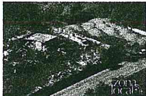
La discarica abusiva. In alto: il sequestro del materiale di risulta. In basso: l'elicottero della Guardia di Finanza

Oltre 2000 metri quadri di terreno in cui erano depositati oltre 1000 quintali di rifiuti speciali e tossici. E' quanto hanno scoperto gli uomini della Compagnia della Guardia di Finanza di Vasto, guidati dal tenente Marco Garofalo, dopo una complessa attività d'indagine. Ieri mattina è scattato il sequestro del terreno, una vera e propria discarica abusiva a cielo aperto, posta lungo la strada di confine tra Vasto e Montedorisio. L'area è risultata essere di proprietà di un cittadino albanese che è stato denunciato per attività di gestione di rifiuti non autorizzata.