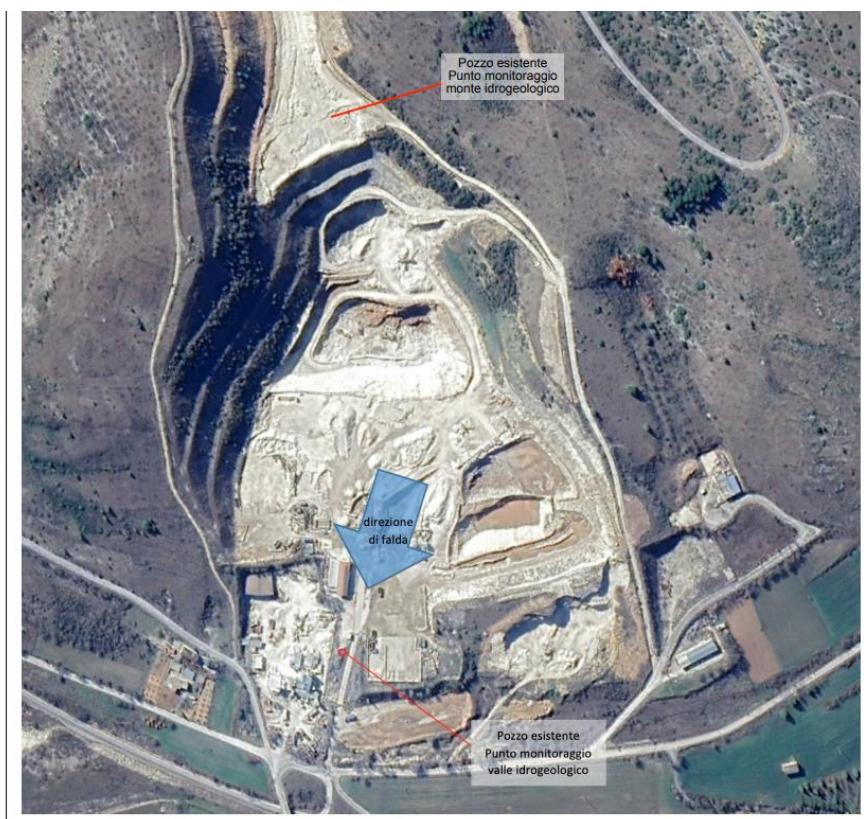
Fig.1- foto satellitare del sito con indicazione della direzione di falda e l'ubicazione dei punti di monitoraggio

Per il monitoraggio della falda in caso di sversamenti accidentali si segnala che è presente subito a monte della cava Di Carlo Mario srl, inteso come monte idrogeologico, un pozzo idrico che può essere utilizzato come punto di campionamento (v.si Fig.1). Quale punto di valle può essere sempre utilizzato il pozzo sopra citato, il quale risulta già essere un punto di monitoraggio utilizzato periodicamente da ARTA”.