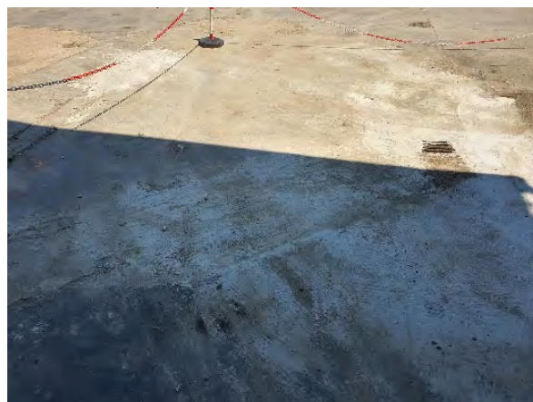
RIPRISTINO FESSURAZIONI SUPERFICIALI