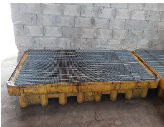
RIRPISTINO BACINI DI CONTENIMENTO