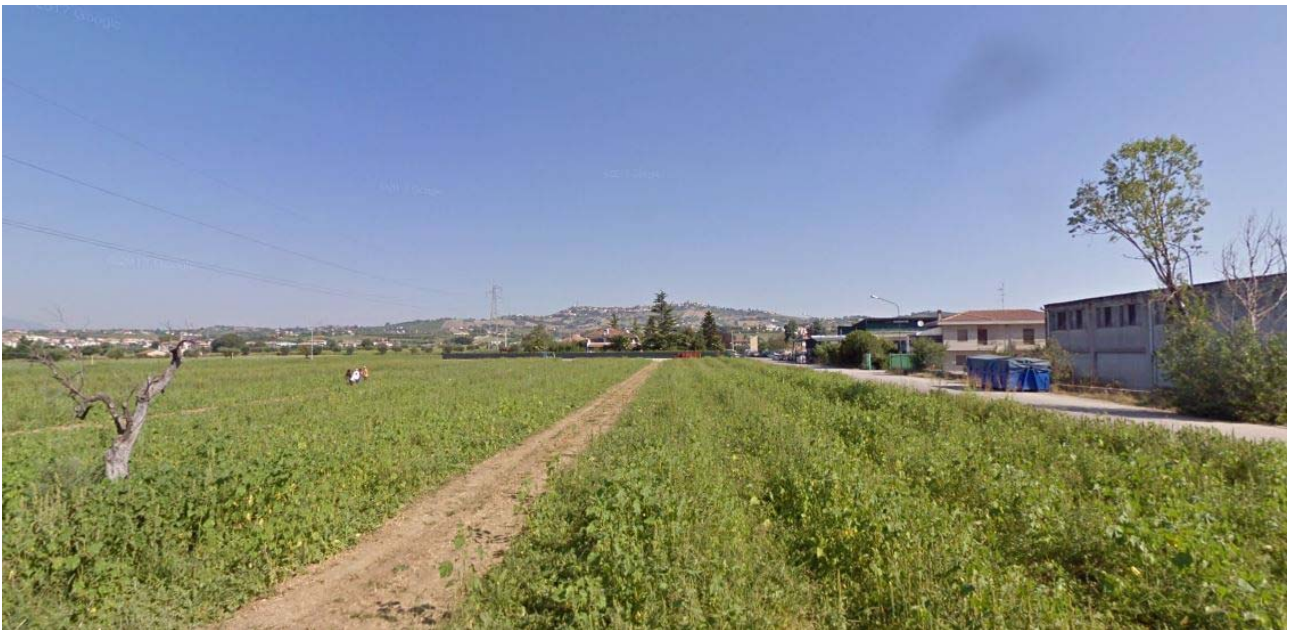
Foto lotto oggetto di variante, vista centrale da sud verso nord