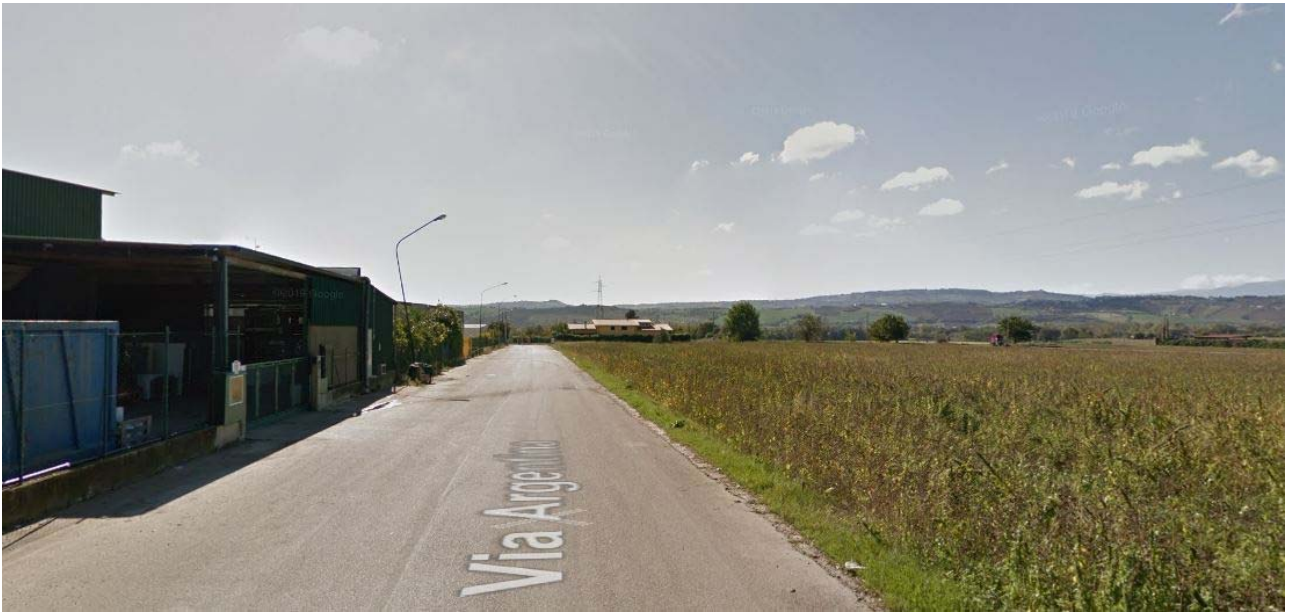
Foto lotto oggetto di variante, vista da nord verso sud, su via Argentina)