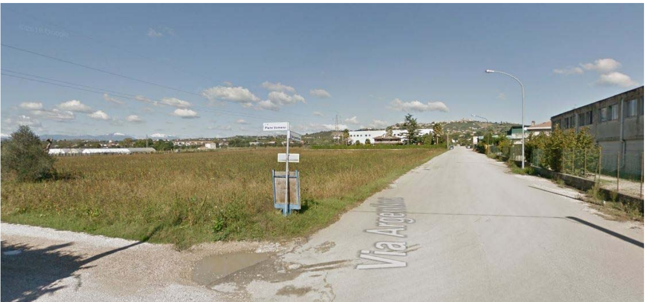
Foto lotto oggetto di variante, vista da sud (incrocio via Piane Vomano, via Argentina)

Ambito oggetto di insediamento attività produttiva (variante di cui art. 8 DPR 160/2010)