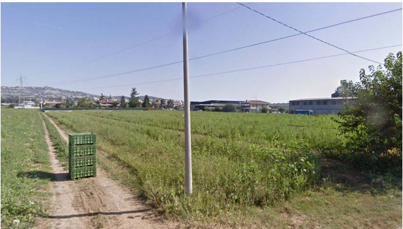
Foto lotto oggetto di variante, vista lato ovest verso nord-est