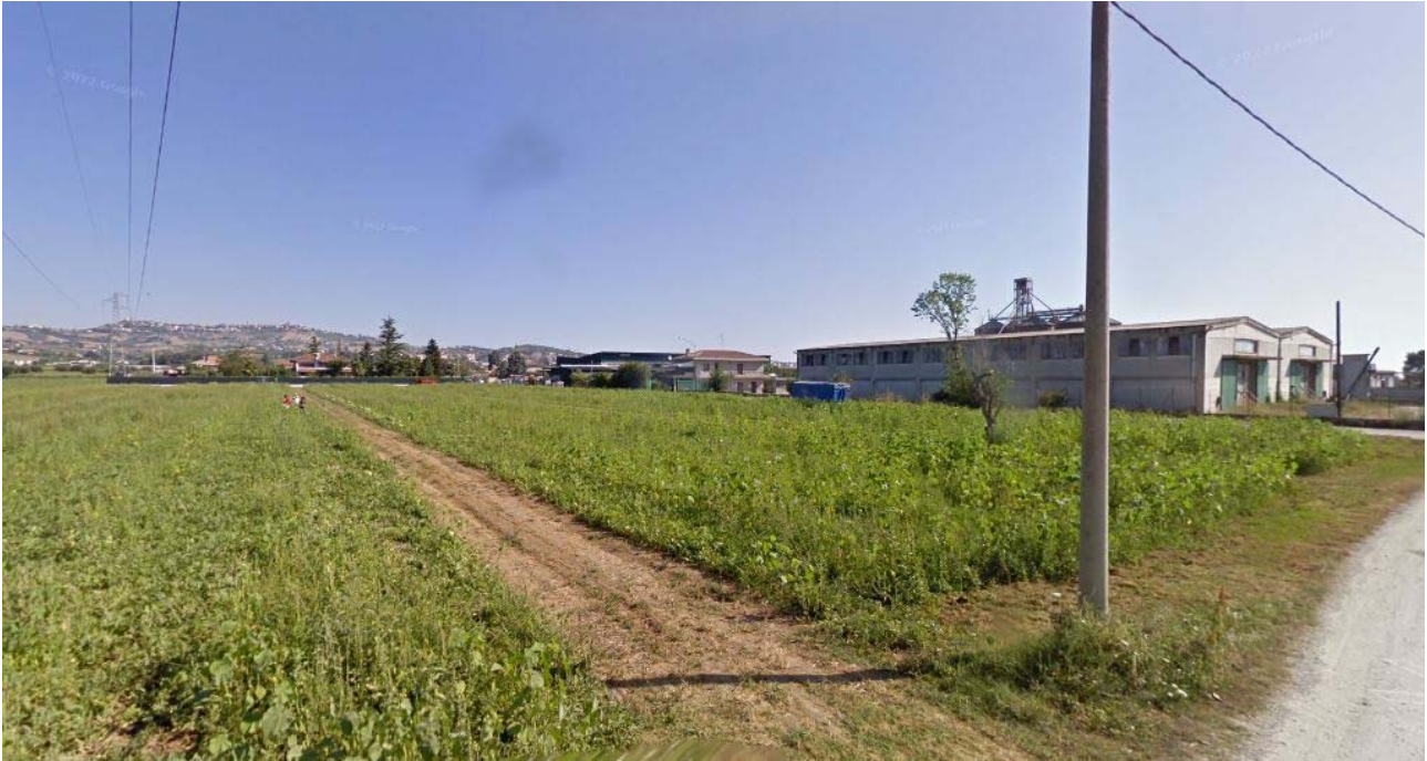
Foto lotto oggetto di variante, vista lato ovest in prossimità delle linea elettrica