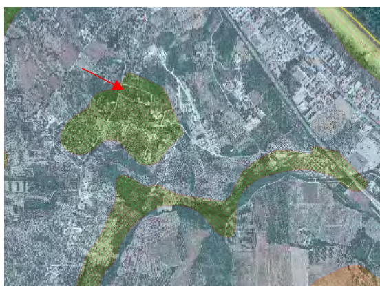
Vincolo A2 del PRP di conservazione parziale

Per quanto di competenza, lo scrivente Servizio Valutazioni Ambientali – Ufficio VAS e Supporto all'Autorità Ambientale, fatti salvi i nulla osta e pareri necessari, in qualità di soggetto con competenza ambientale comunica la necessità di riportare, nel Rapporto Ambientale, i contenuti di cui all'Allegato VI alla Parte II del D.Lgs. n. 152/2006 (come evidenziato a pag. 37 del Rapporto Preliminare), con particolare riferimento a quanto richiesto dalla lettera a) e f) del citato allegato. In particolare si ritiene necessario valutare la coerenza dell'intervento con il Piano Regionale Paesistico in quanto i lotti fondiari F3 – F4 – F5 ed una parte dell'F2 sono ricompresi in Zona A2, di conservazione parziale.