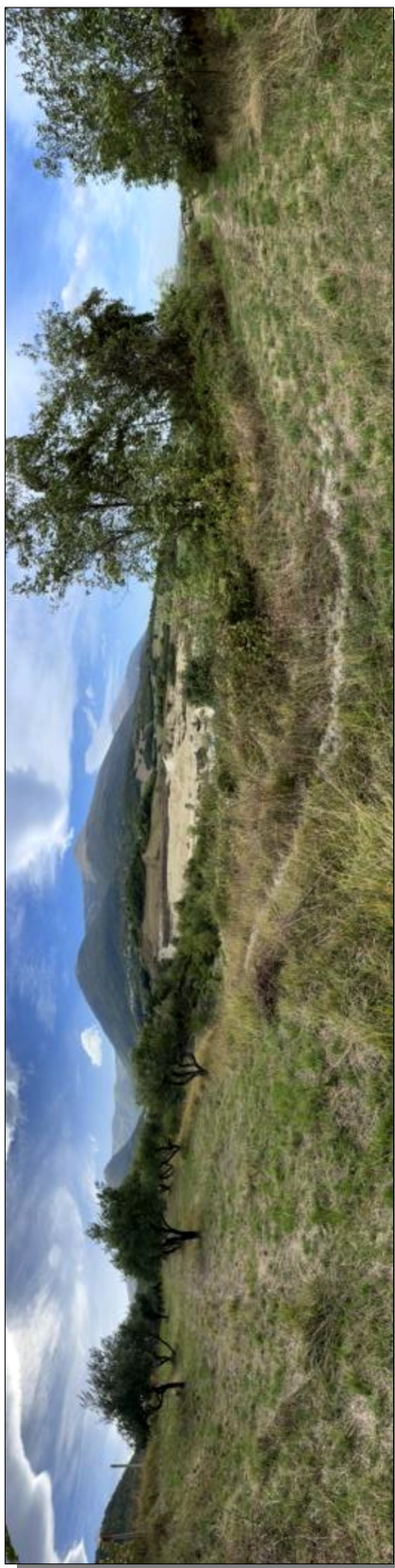
Foto 5: Vista d'insieme dell'area di cava, come si presenta oggi (Novembre 2023).