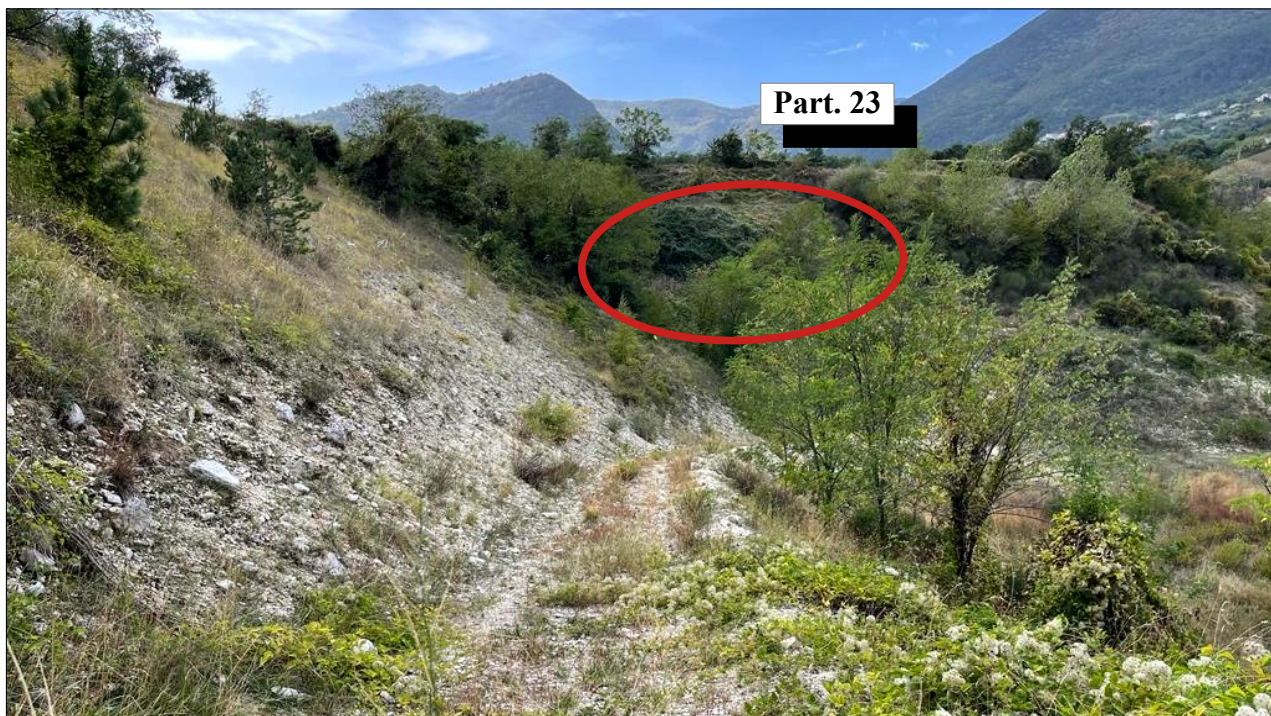
Foto 2: Particolare della strada interna, oggetto di richiesta di modifica.