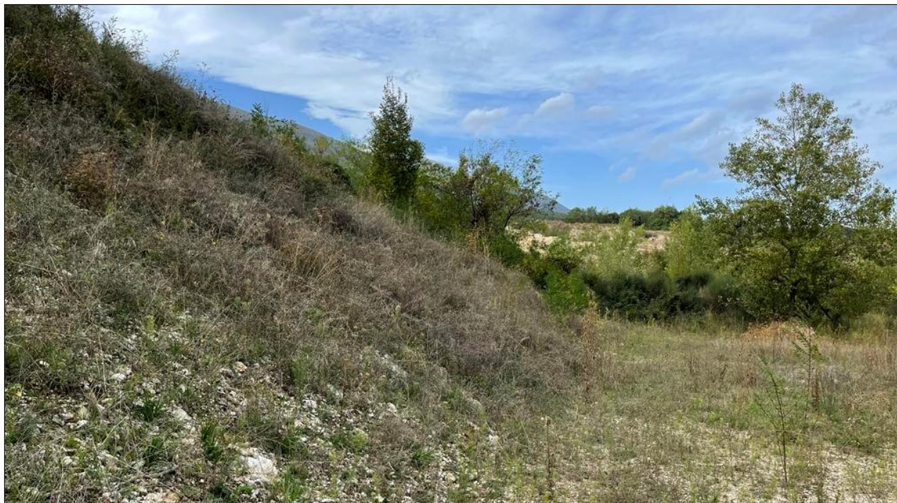
Foto 3: Particolare del piede della scarpata lato W e rinverdimento.