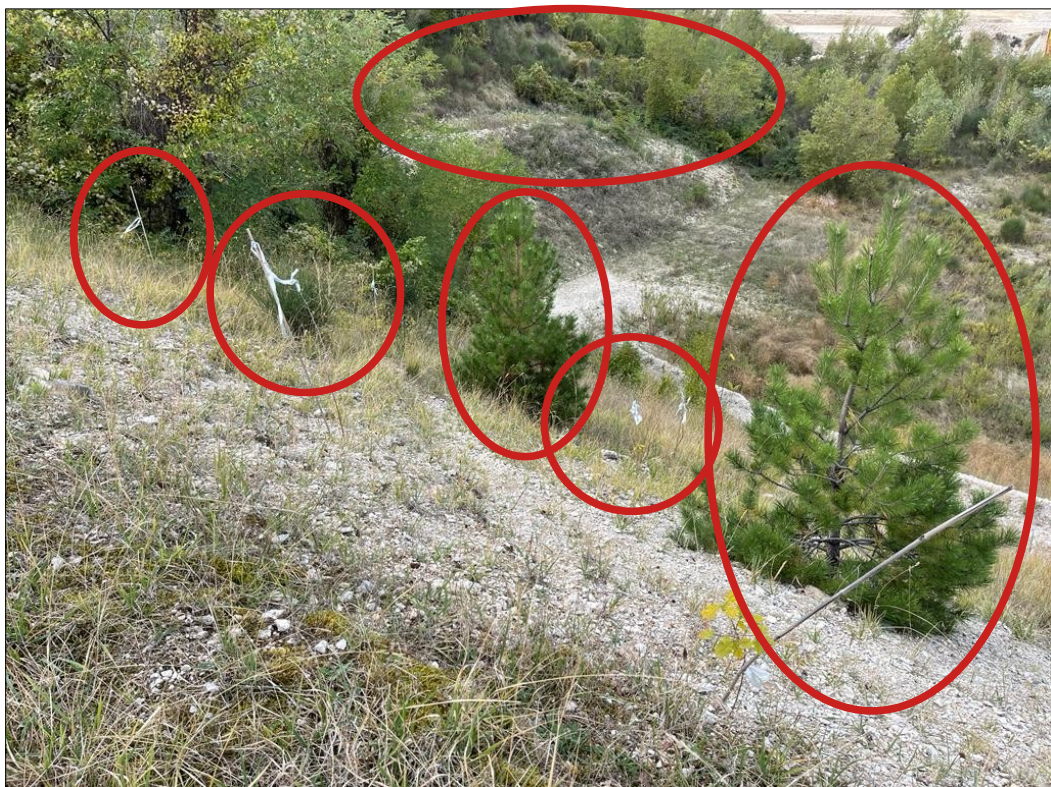
Varie specie di piante autoctone, ad alto fusto, poste a dimora nell'area di cava.