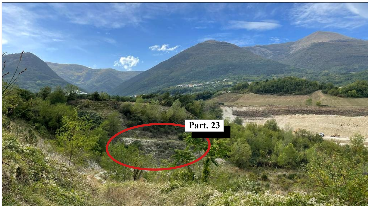
Foto 1: Vista dell'area di cava da SE, in prossimità dell'ingresso.