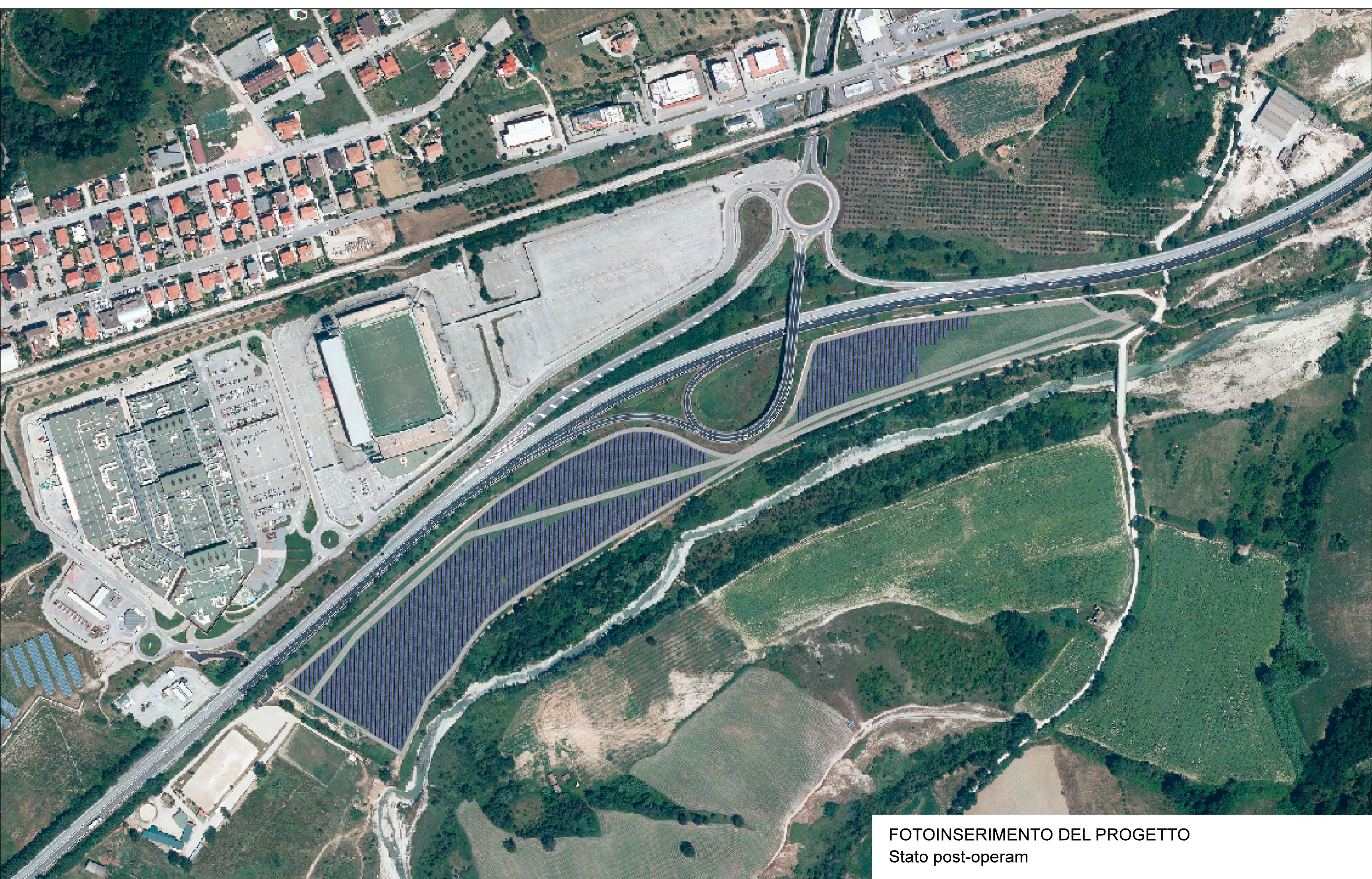
FOTOINSERIMENTO DEL PROGETTO Stato post-operam