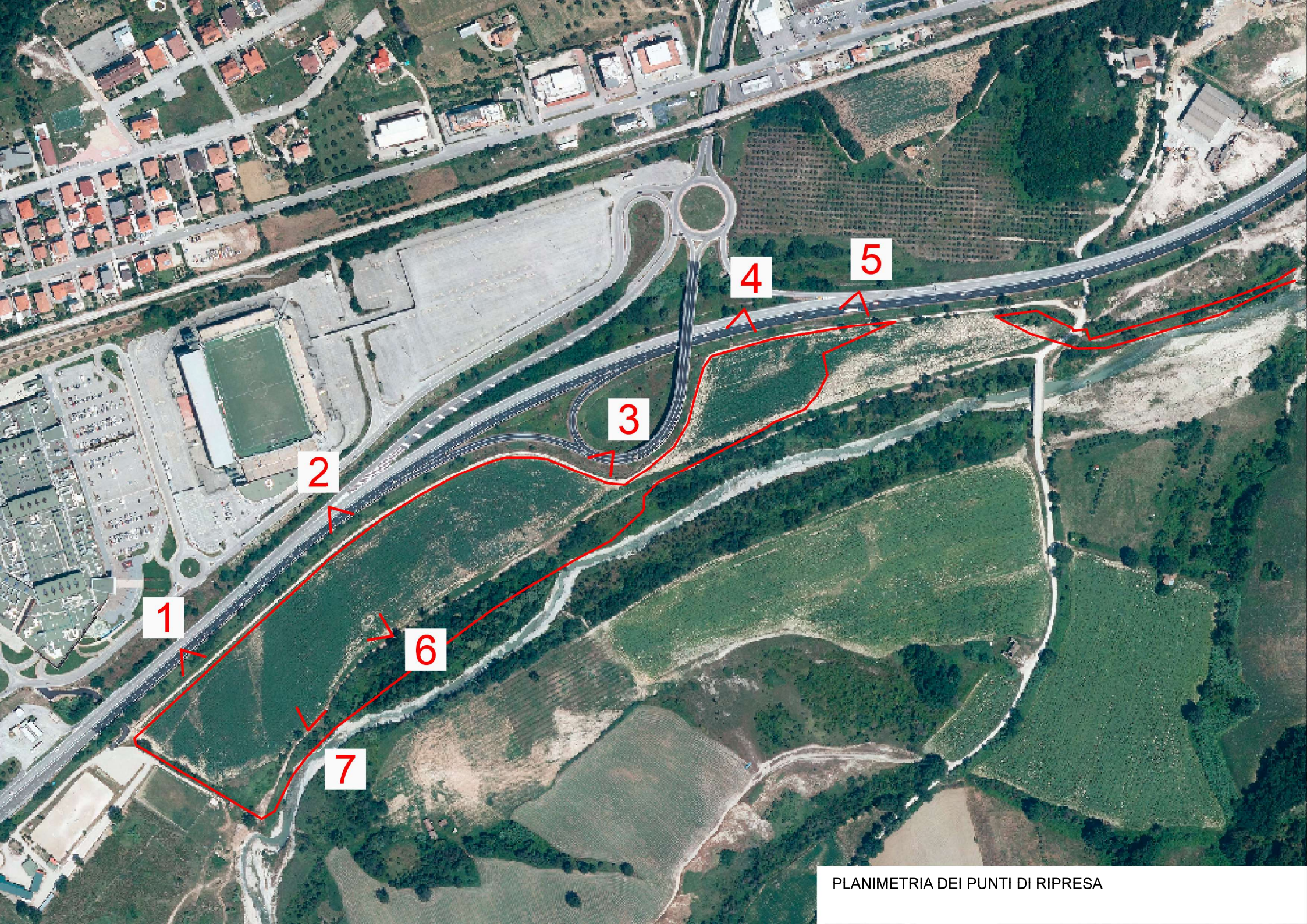
PLANIMETRIA DEI PUNTI DI RIPRESA