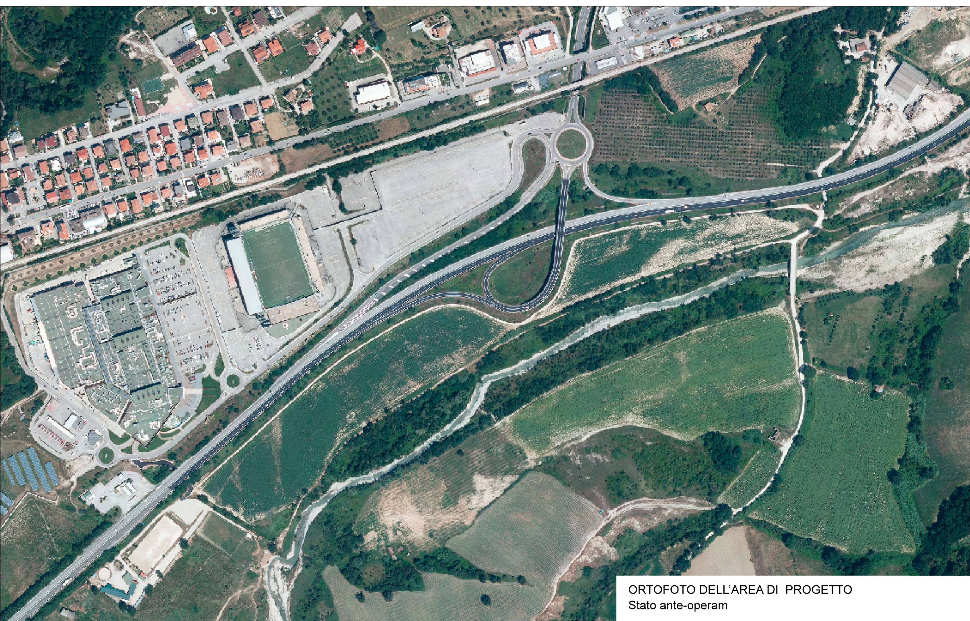
ORTOFOTO DELL'AREA DI PROGETTO Stato ante-operam