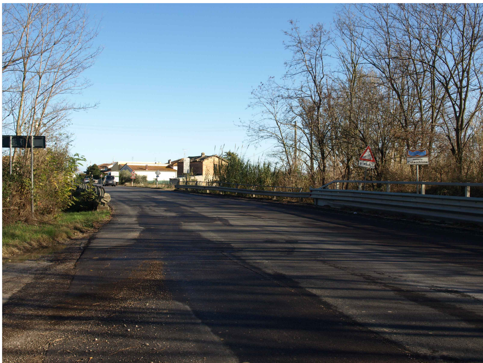
FOTO 02 - INTERFERENZA CON PONTE