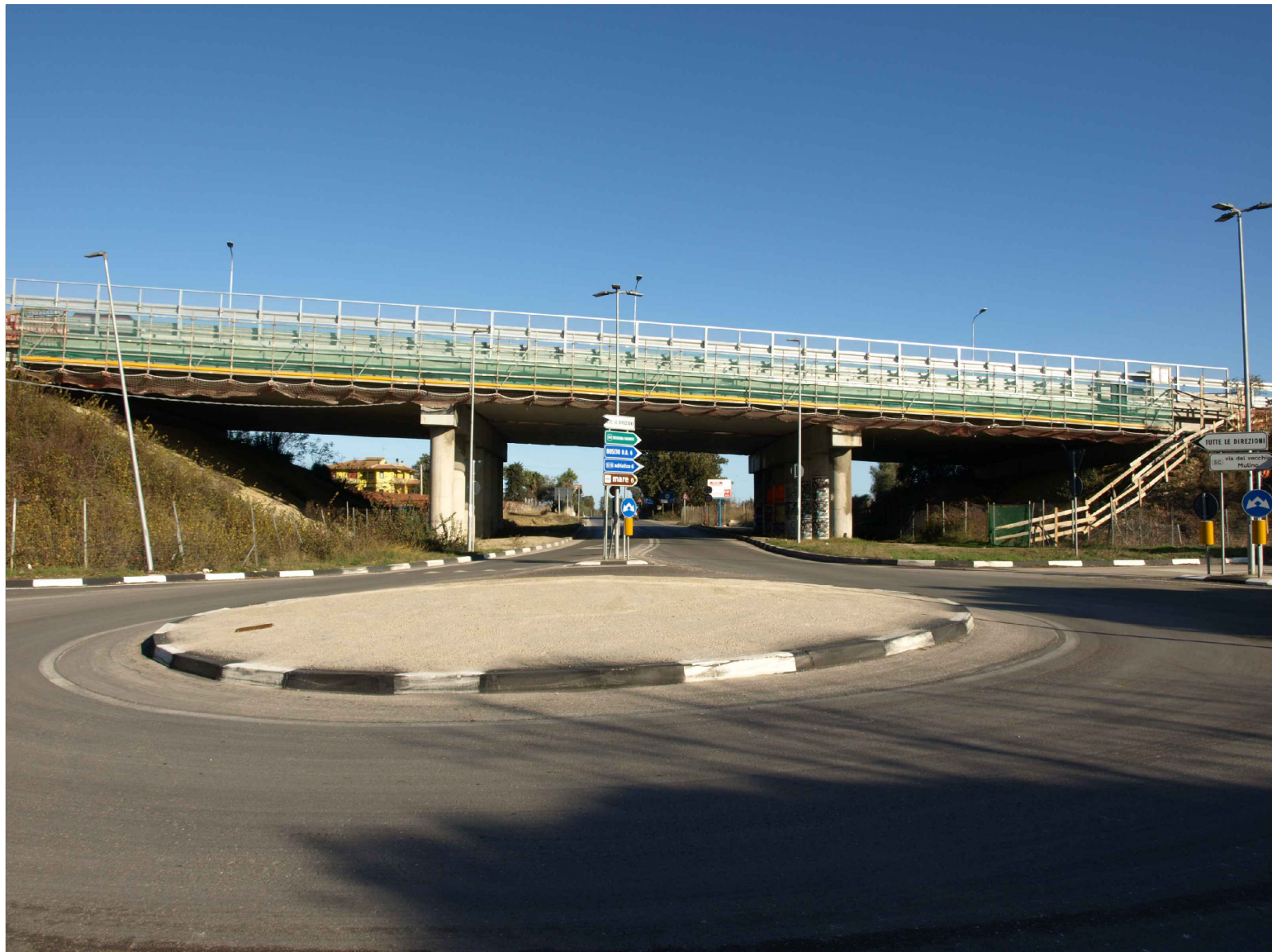
FOTO 01 - INTERFERENZA CON AUTOSTRADA A14