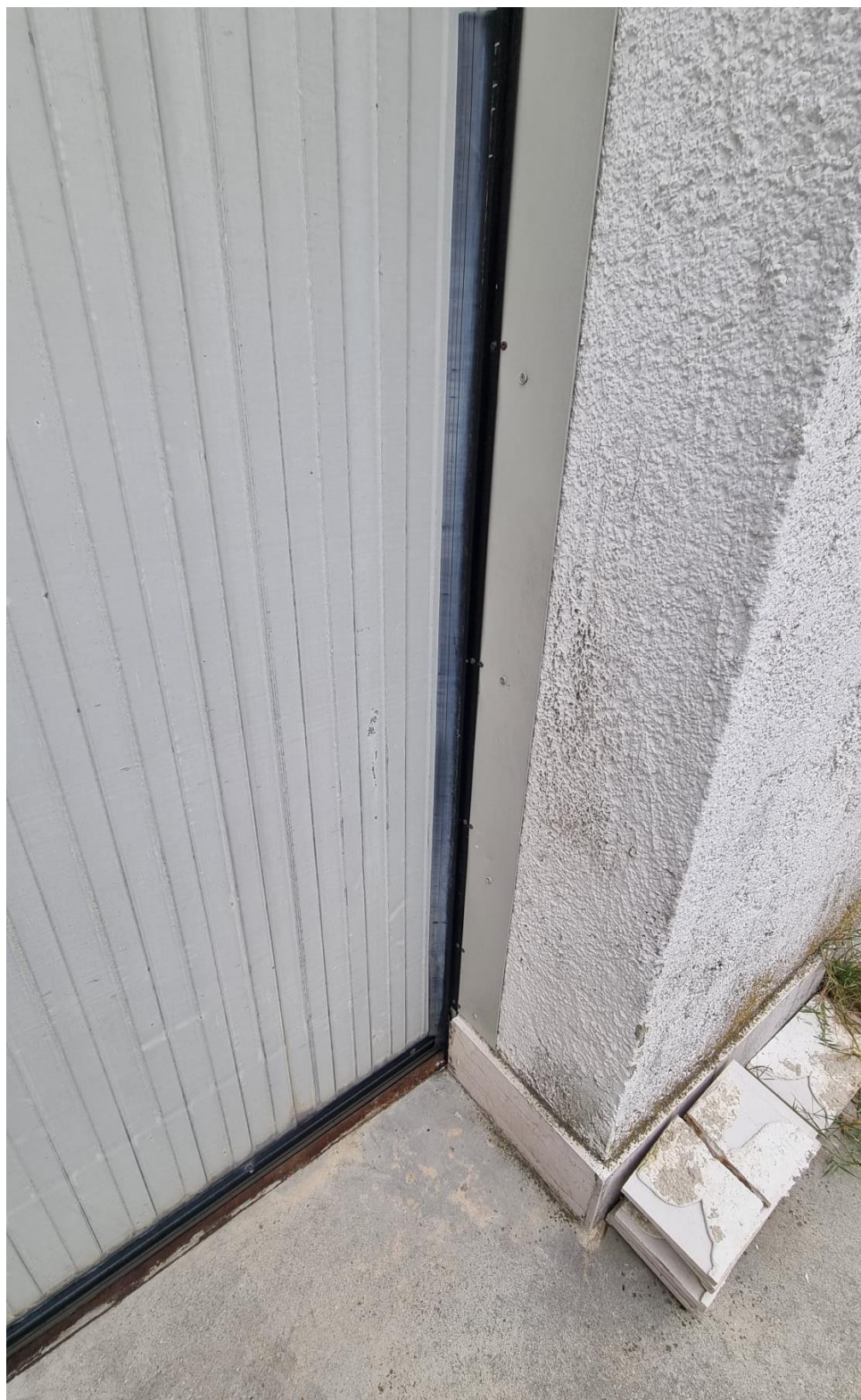
Figure 6 Particolare sistema di chiusura a tenuta stagna – vista dall'esterno

3 Dotare gli ingressi dell'opificio di sistema di chiusura a tenuta stagna tale da non consentire all'acqua di entrare all'interno del deposito.”