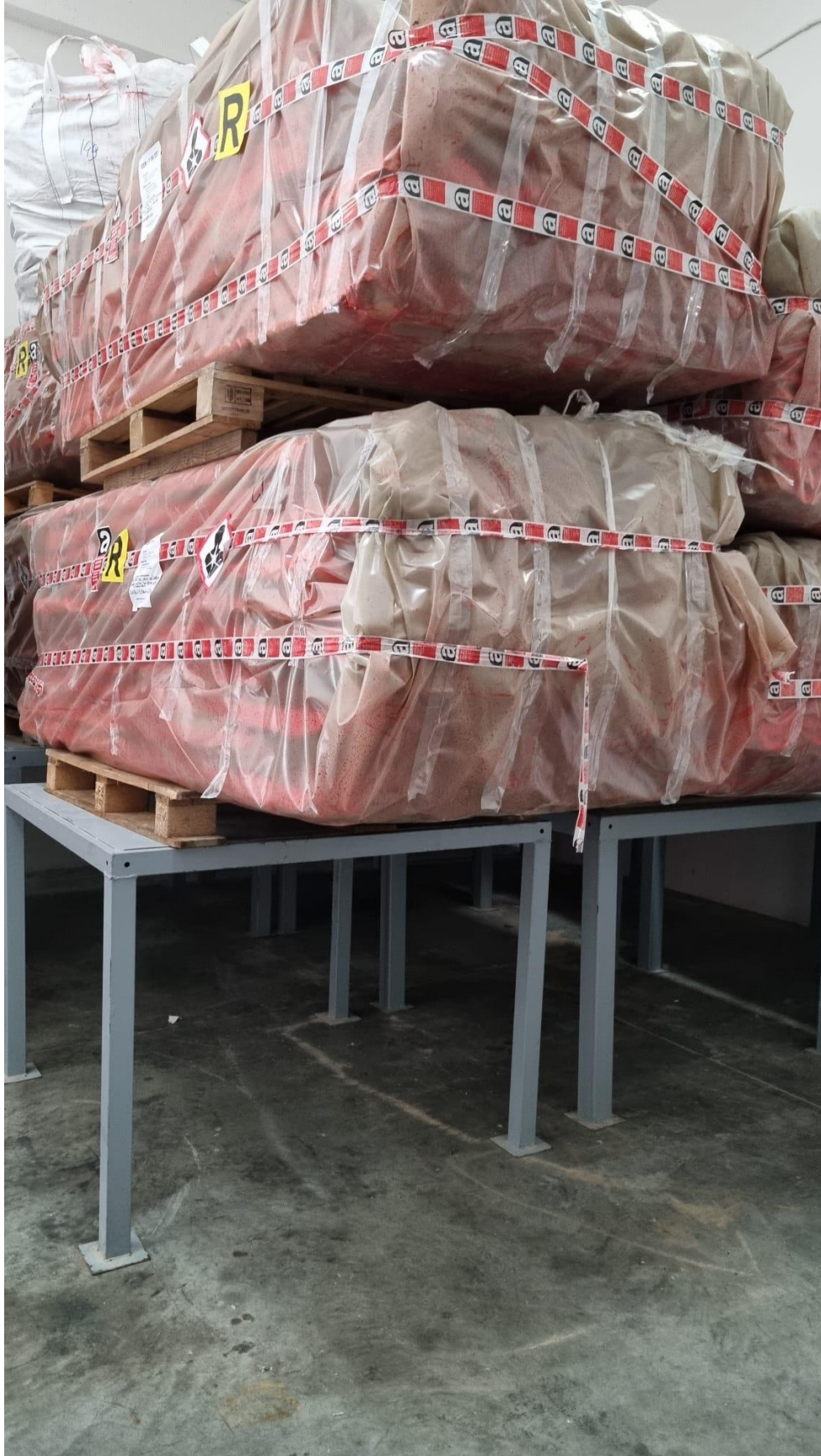
Figure 1 Particolare area di stoccaggio sopraelevato