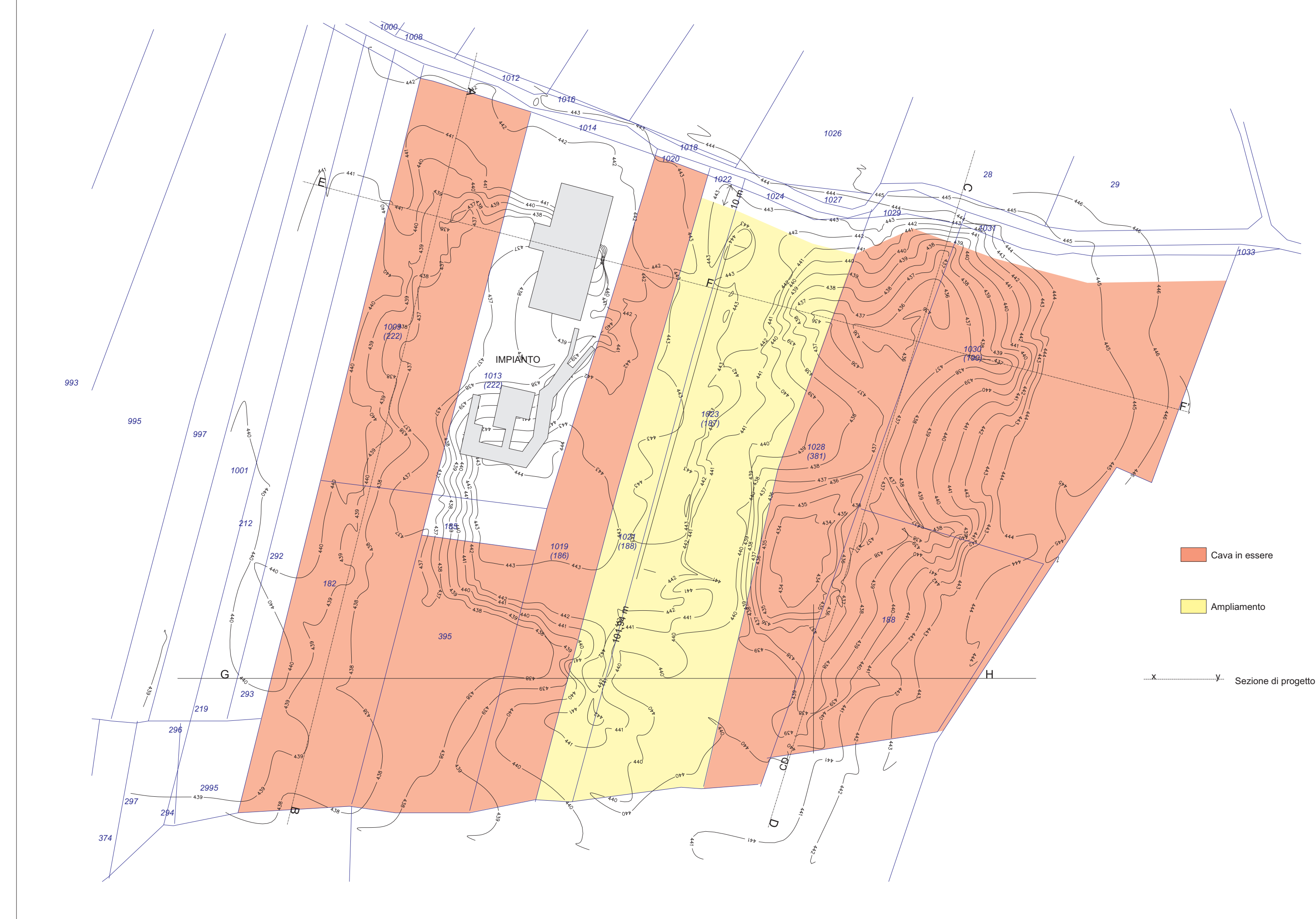
Cava in essere Ampliamento