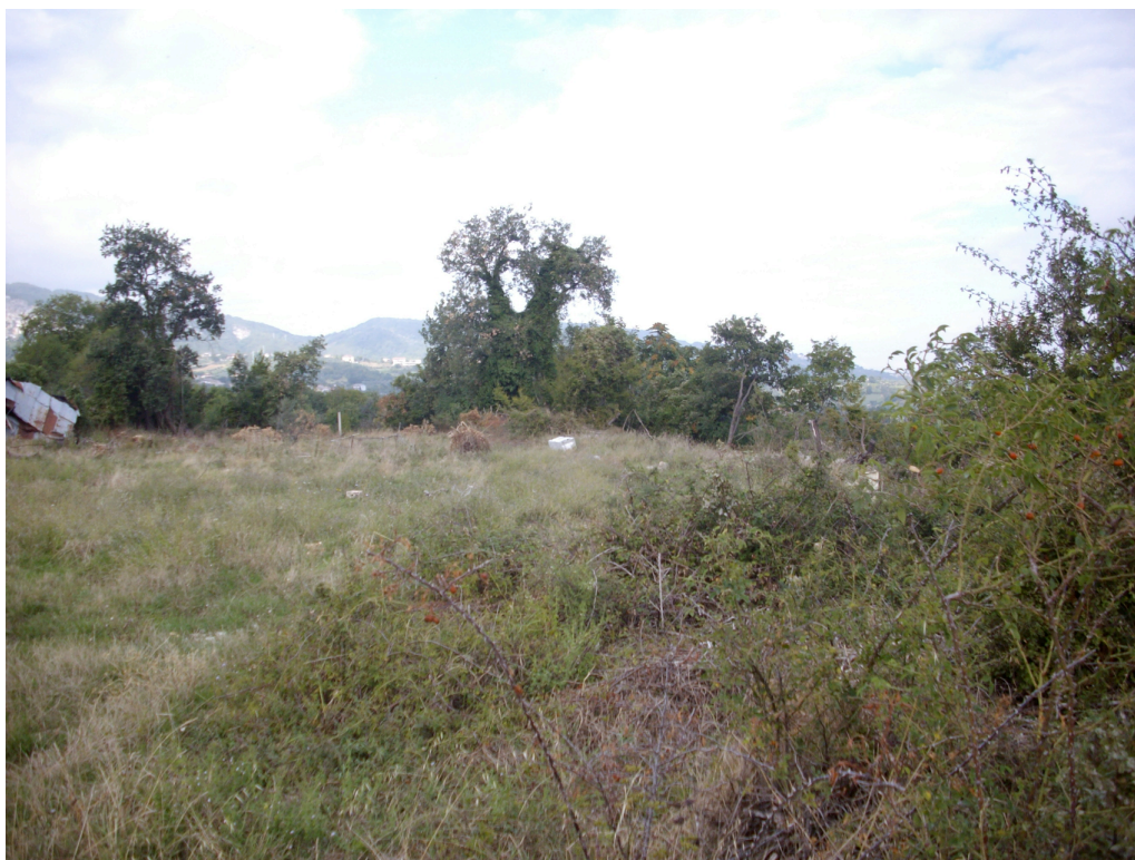
Inquadratura n. 2