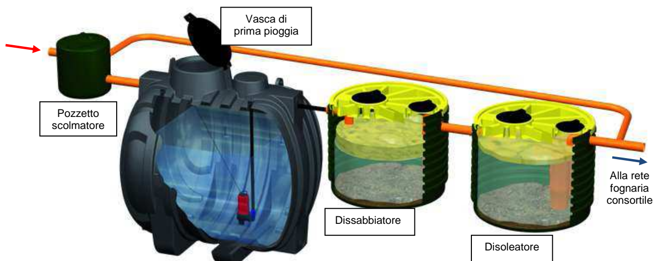
Figura 3 - Schema impianto di prima pioggia