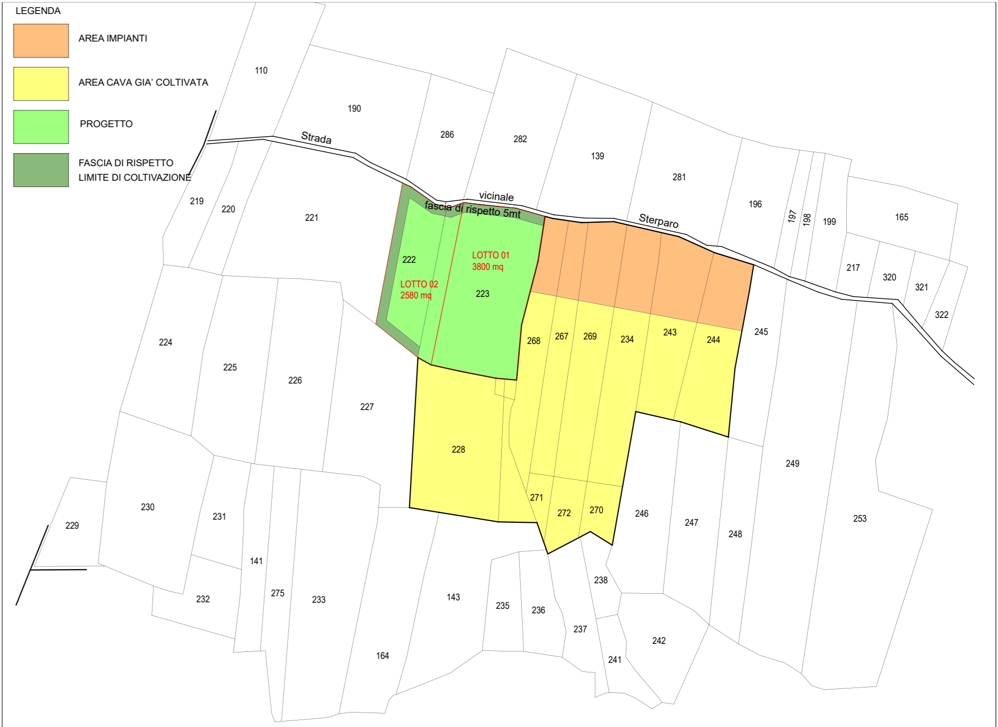
CATASTALE AREE INTERVENTO