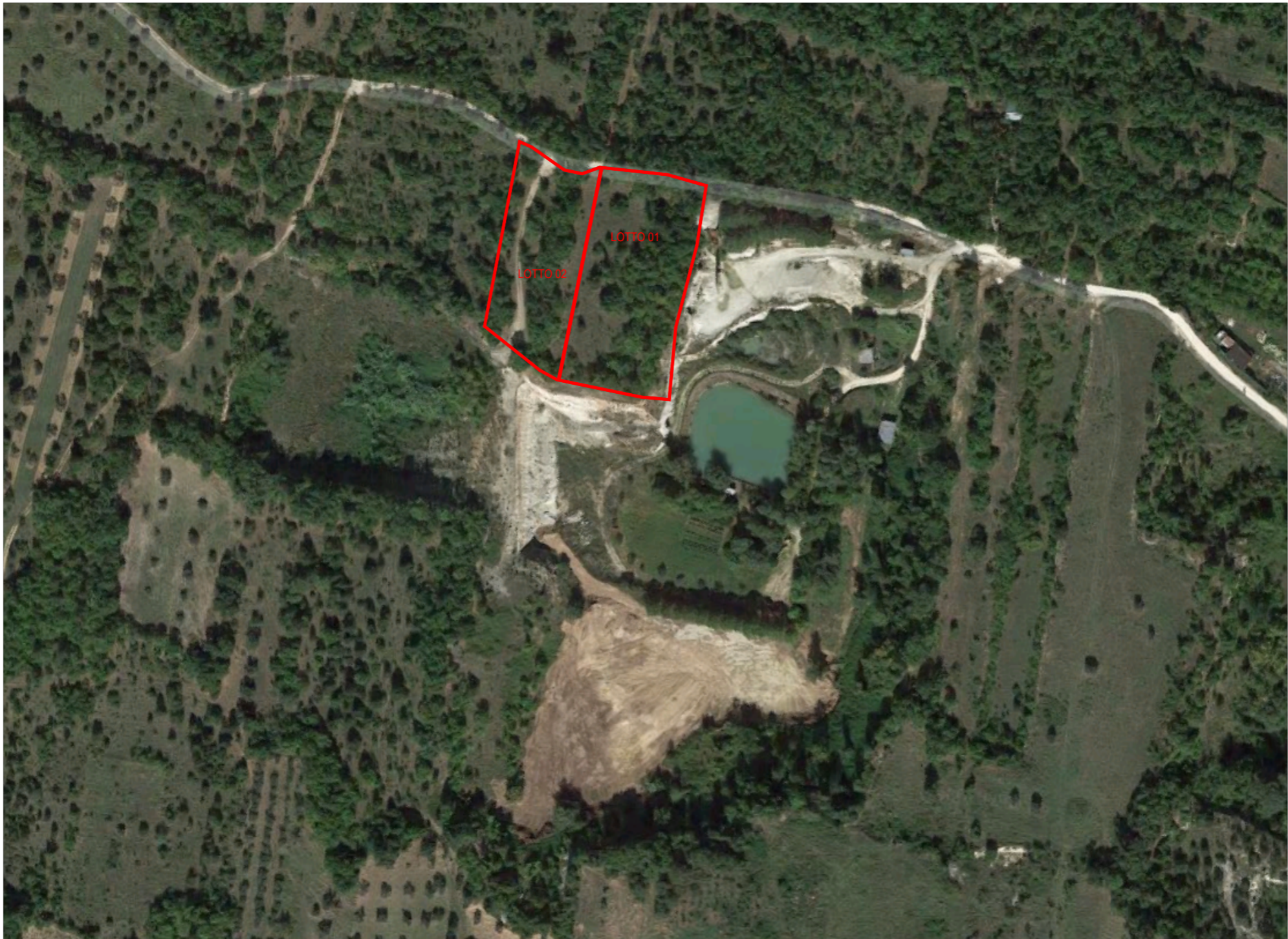
STATO DI FATTO - AREA DI PROPRIETA'