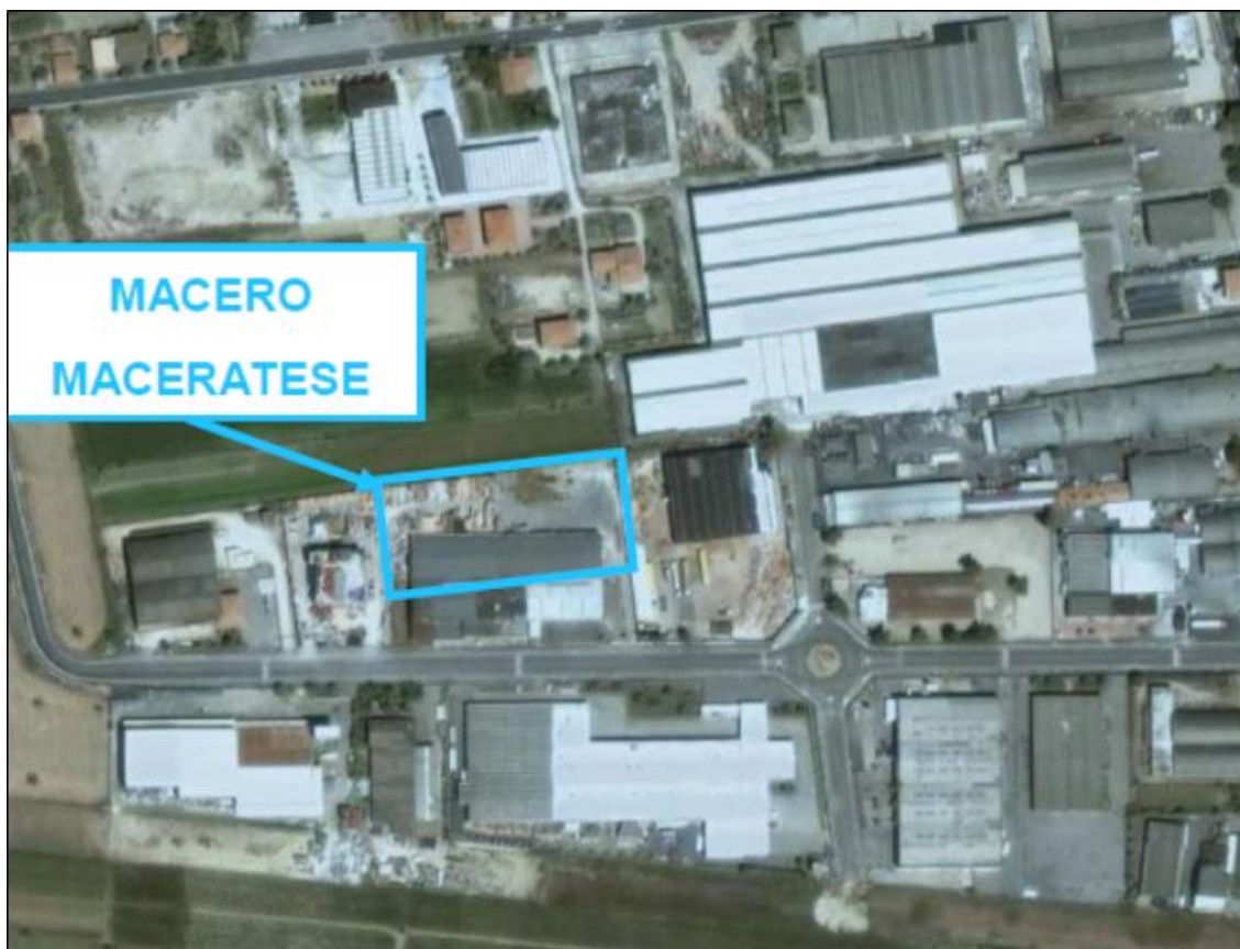
Stralcio Ortofoto (dallo SPA)