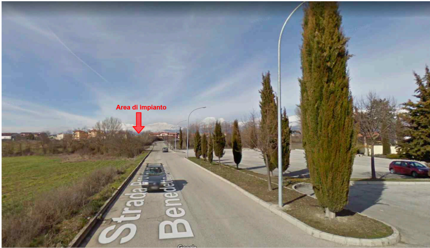
1_Cimitero comunale - L'area non risulta visibile per la presenza di elementi antropici e naturali