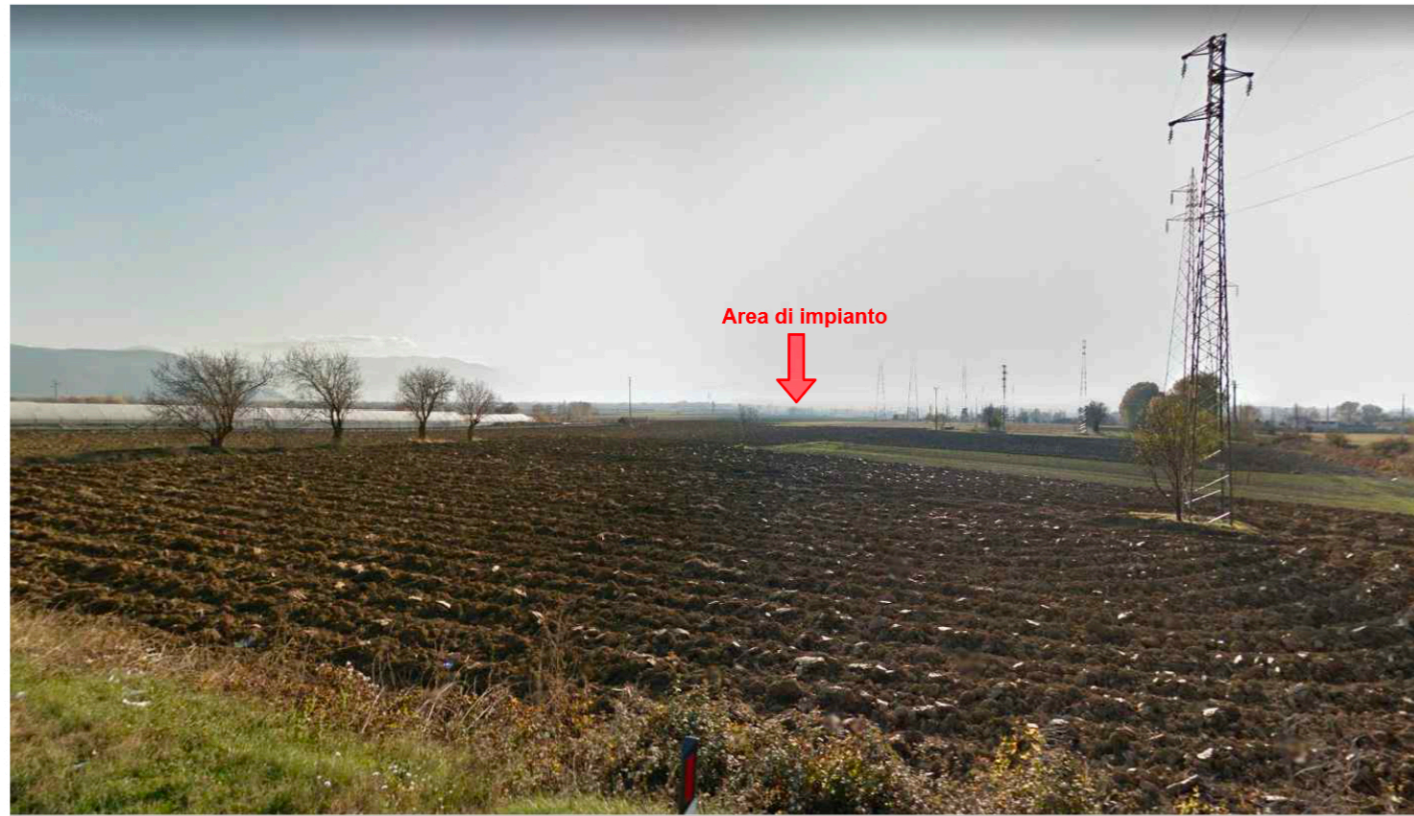
3_SS83 Marsicana - L'area dista circa 2.5 km dalla SS83 pertanto l'impianto non risulta visibile