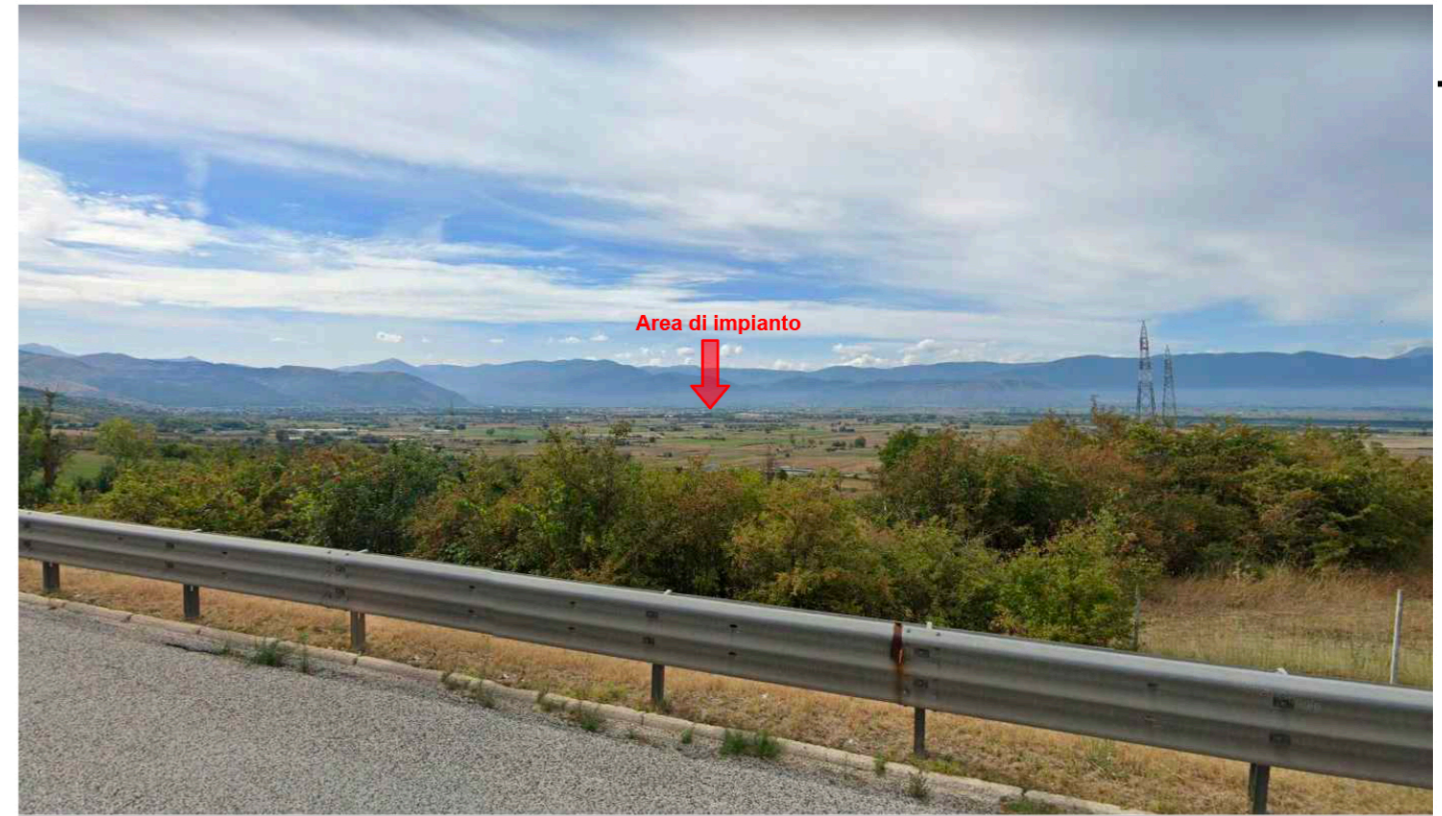
4_Autostrada E80 - L'area dista circa 3.5 km dall'asse autostradale, pertanto l'impianto non risulta visibile

L'area di impianto è stata inquadrata da diversi punti di interesse presenti nella zona circostante e avendo caratteristiche orografiche prevalentemente pianeggianti, mancano punti di vista panoramici o belvedere prossimi all'area di intervento.