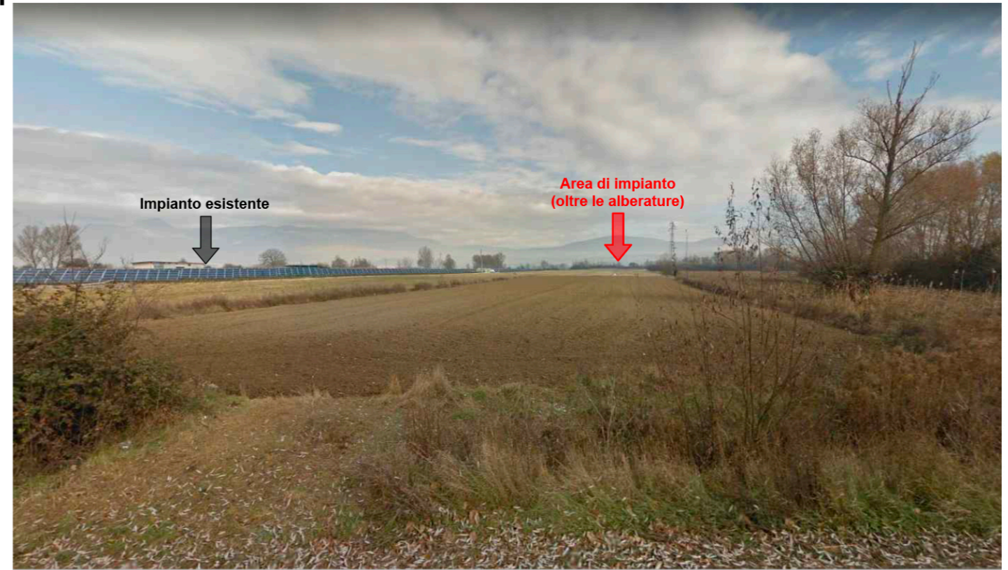
2_Via Circonfucense - L'area non risulta visibile per la presenza di elementi naturali