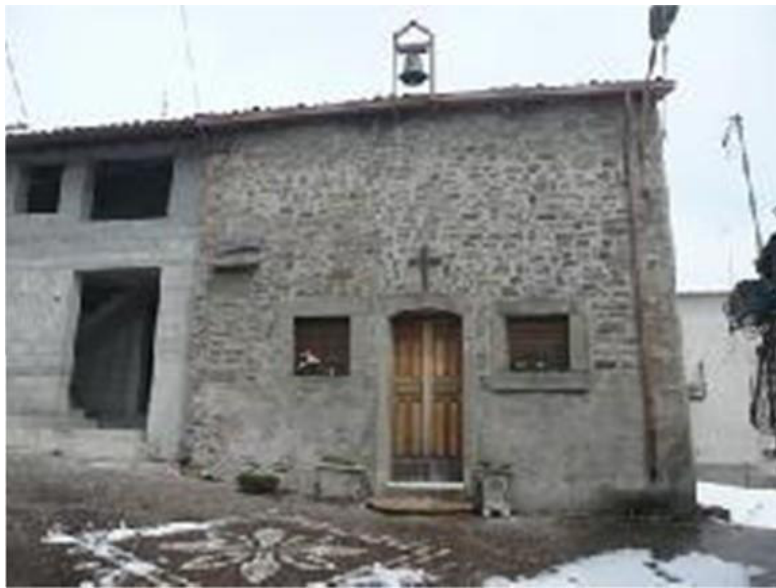
CHIESA BEATO ANDREA a Mascioni