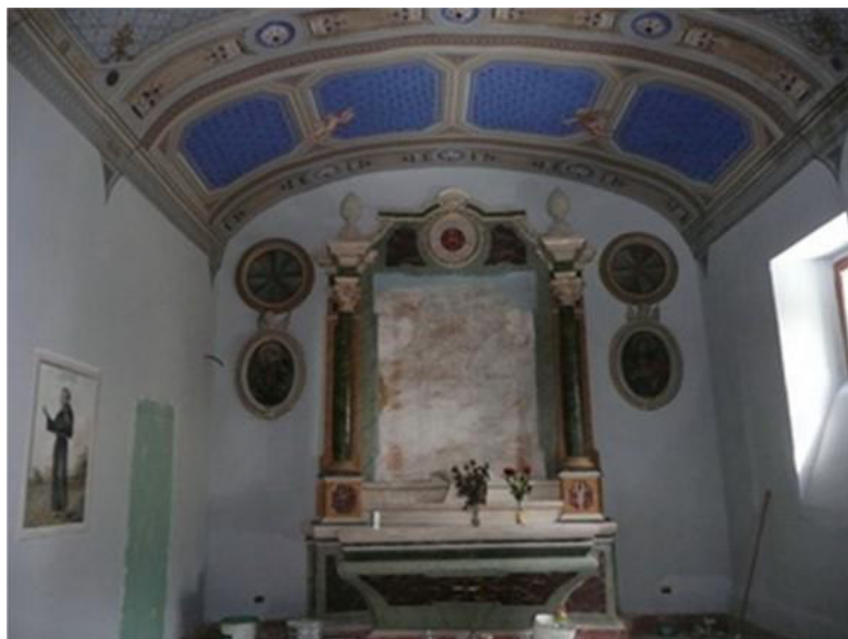
CHIESA BEATO ANDREA a Mascioni interni