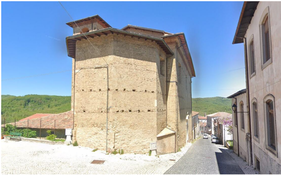
CHIESA BEATO ANDREA a Montereale