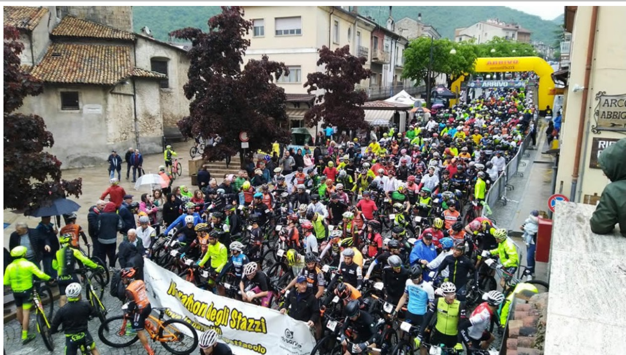
Partenza da P.zza S.Maria della Valle in Scanno