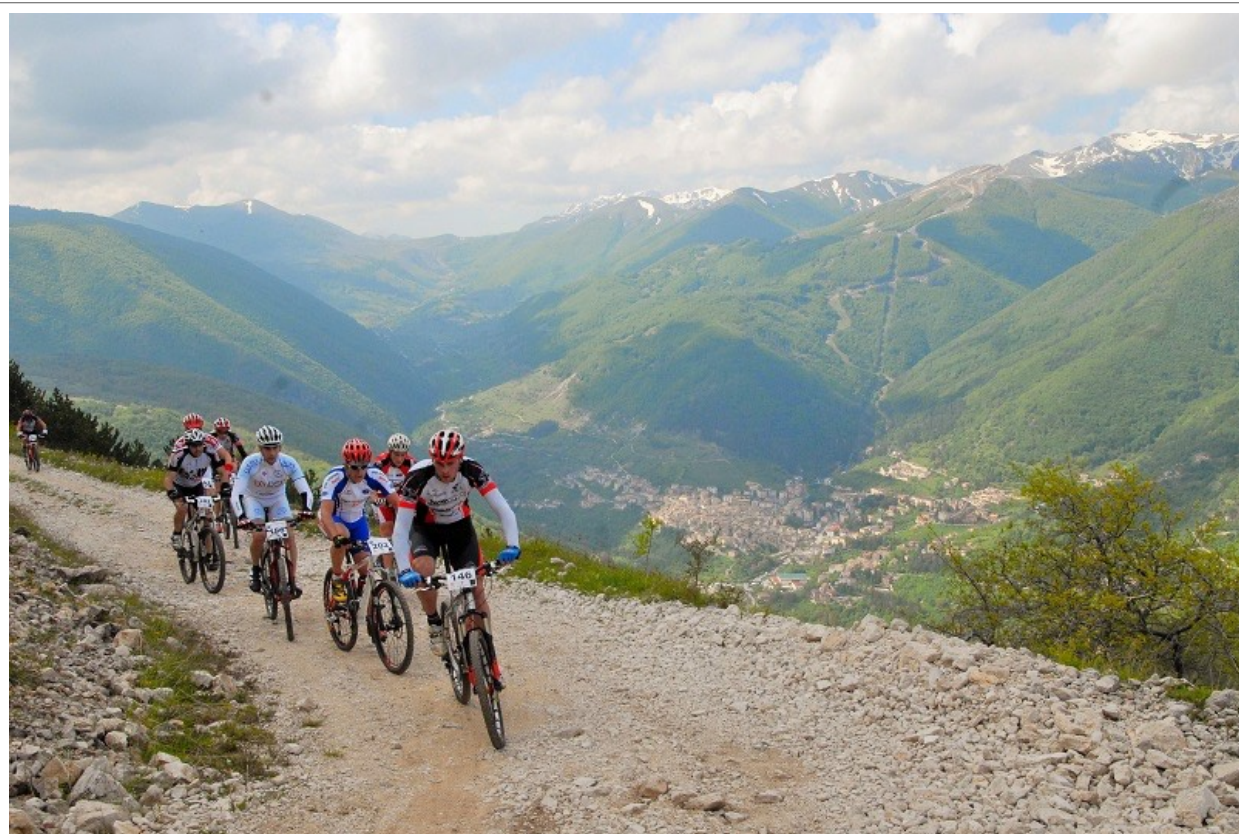
Salita su strada bianca M.te Genzana