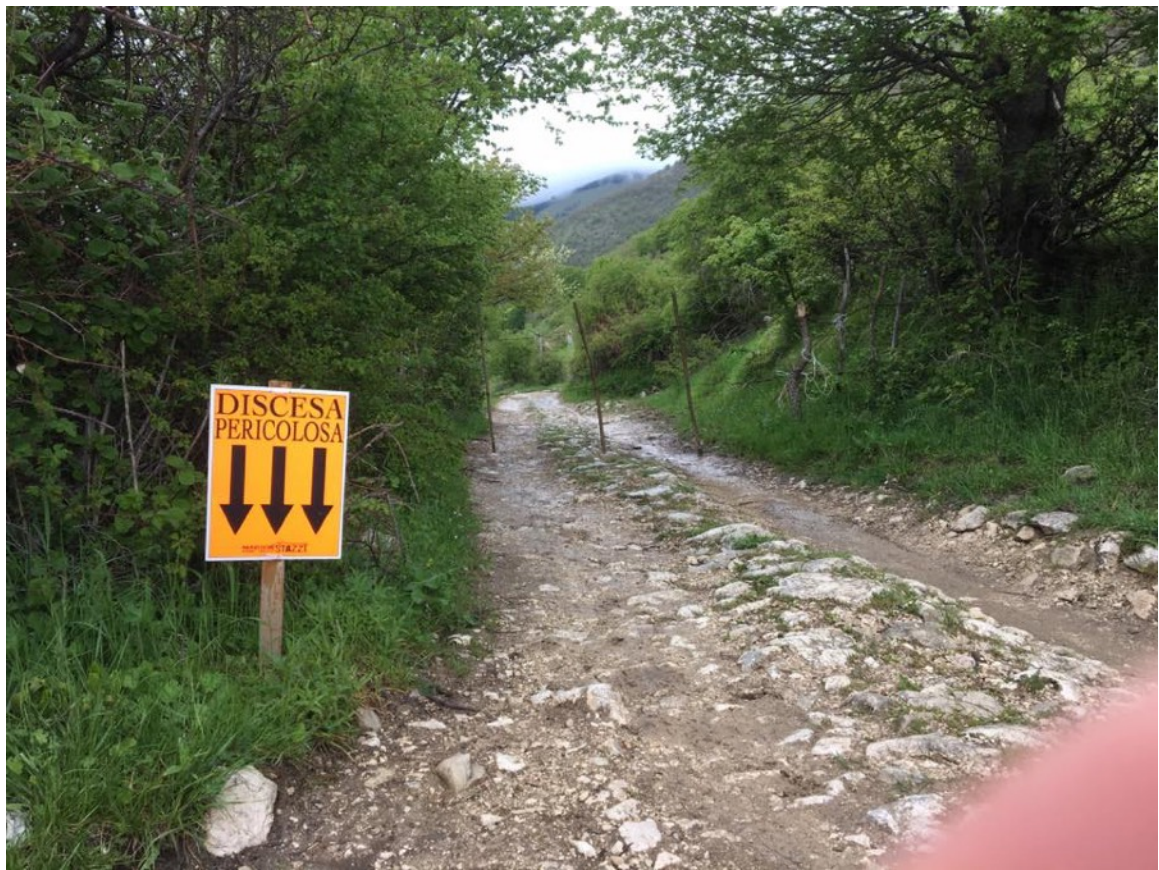
Passaggio Vallone di Jovana (particolare segnaletica alta visibilità)