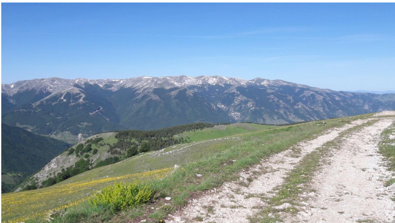
Panoramica da M.te Genzana