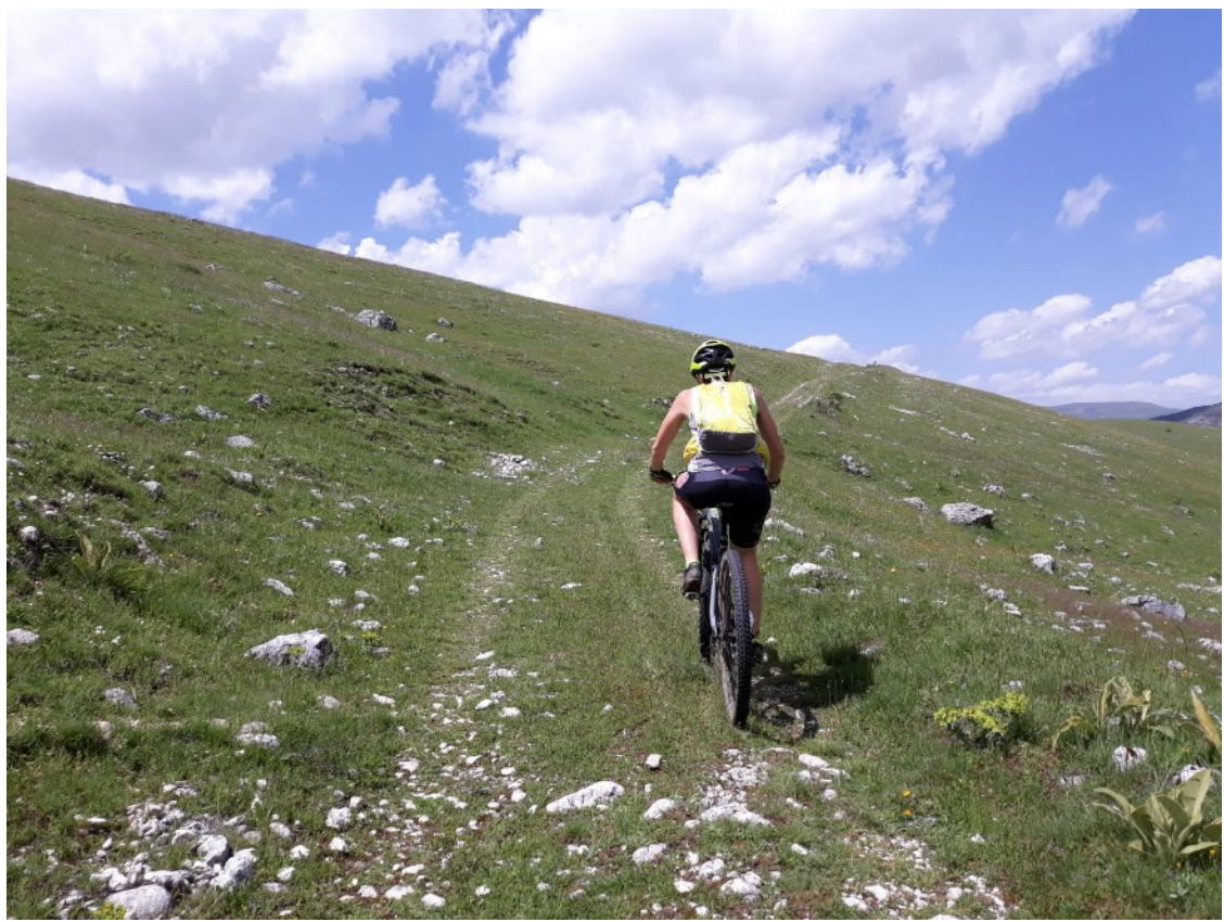
Passaggio località Zio Mass