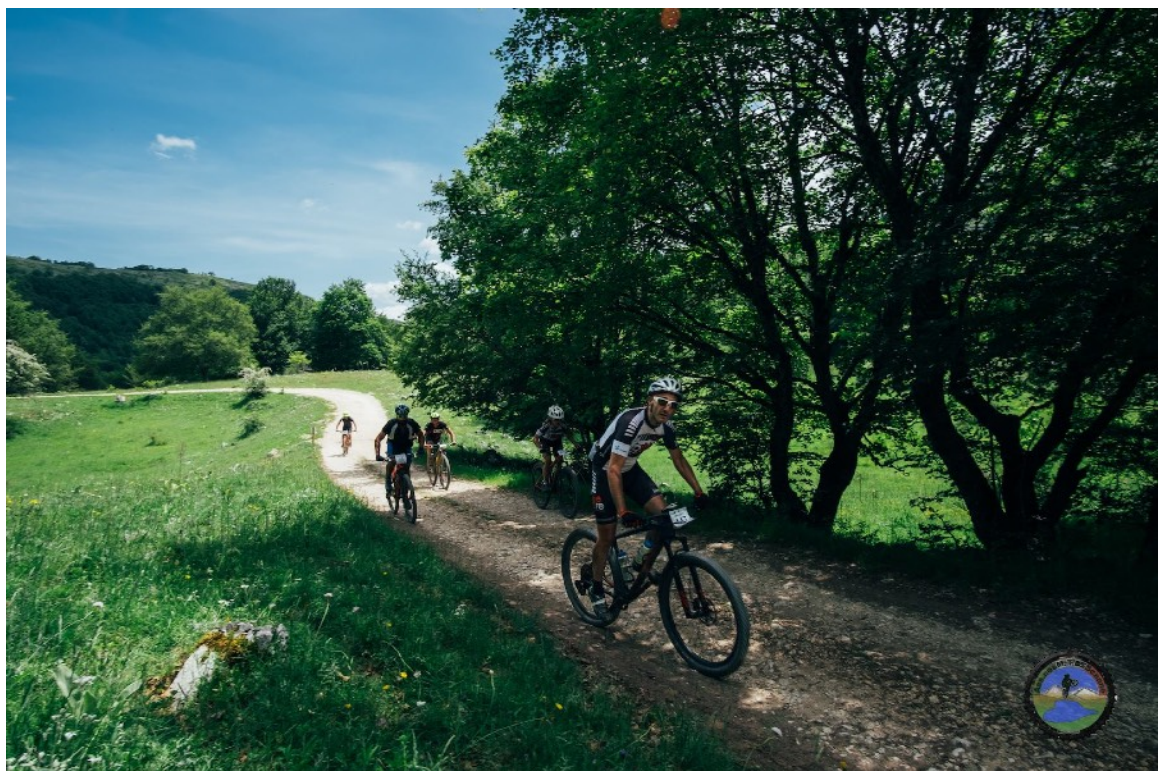
Passaggio su Strada bianca località Mimola