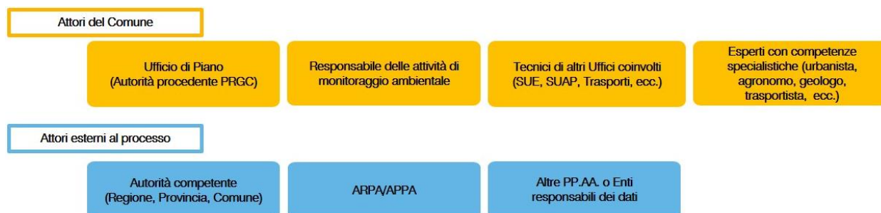
Figura 2. Schema di governance per il monitoraggio ambientale del PRGC